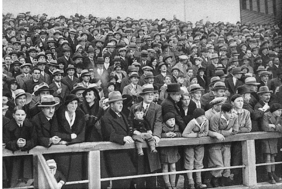
Die Zuschauer auf der Dolder-Kunsteisbahn in Zürich verfolgen mit gespannter Aufmerksamkeit die Darbietungen auf dem Eise