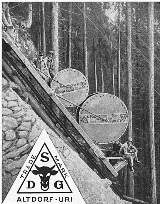
Verlegung der Bleikabel für KW-Sernf-Niedererbach. Pose des câbles sous plomb pour la Centrale de Sernf-Niedererbach