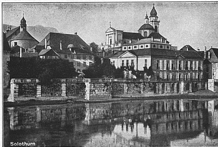
Solothurn: Alter Bischofspalast und St. Ursuskathedrale

Auskünfte bereitwilligst durch die Stationen der Solothurn-Zollikofen-Bern-Bahn und die Betriebsdirektion in Solothurn