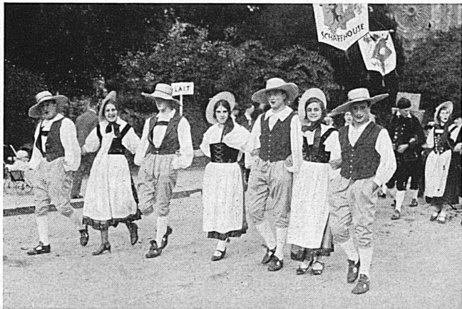
Das Winzerfest in Neuenburg am 1. Okt. ist ein grosses Herbstereignis, das niemand versäumen sollte