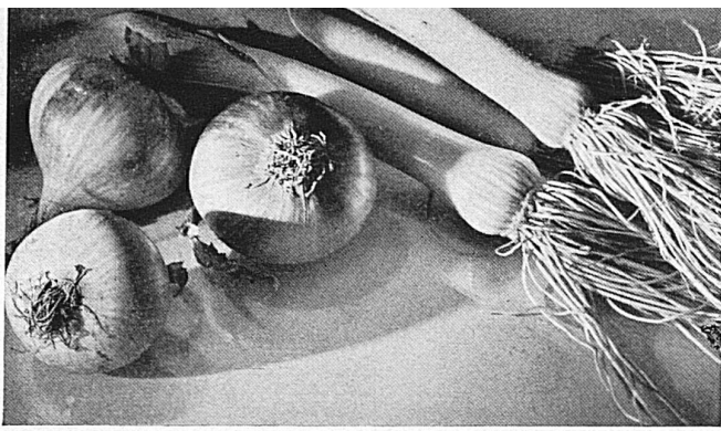
Freiburg zeigt vom 5.-16. Okt. in einer Nahrungsmittelmesse seine Erzeugnisse aus Feld und Garten und die übrigen Produkte für Küche und Keller