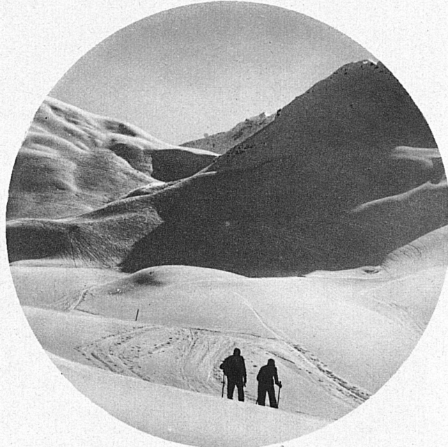
Sonnige Winterstunden im Gebirge!