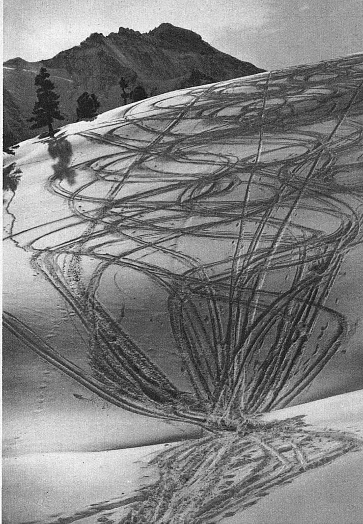
La neige vous appelle!

La plupart des chemins de fer suisses de montagne, qui en hiver servent surtout aux sports, accorderont d'importantes réductions de prix, par exemple des abonnements spéciaux donnant droit certains jours, à un nombre illimité de courses.