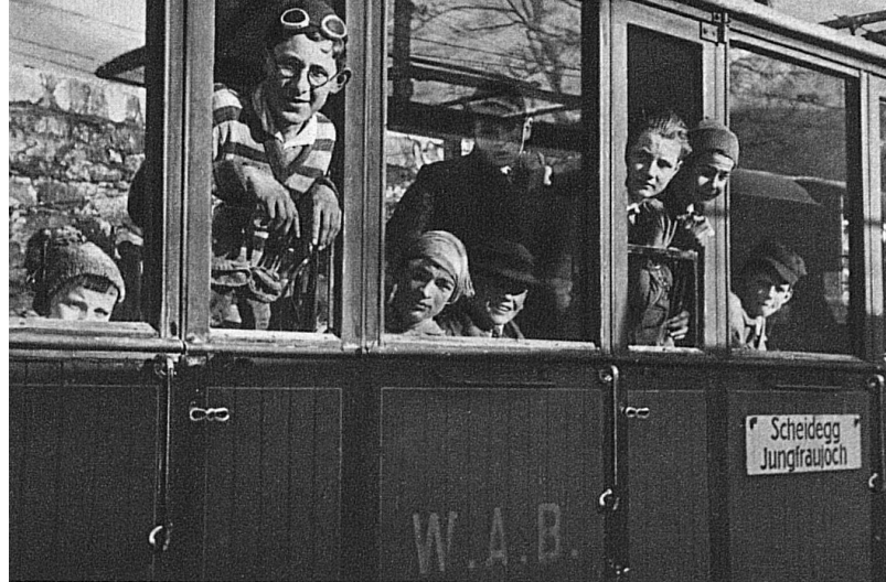
Alles fährt mit Sonntagsbilletten!