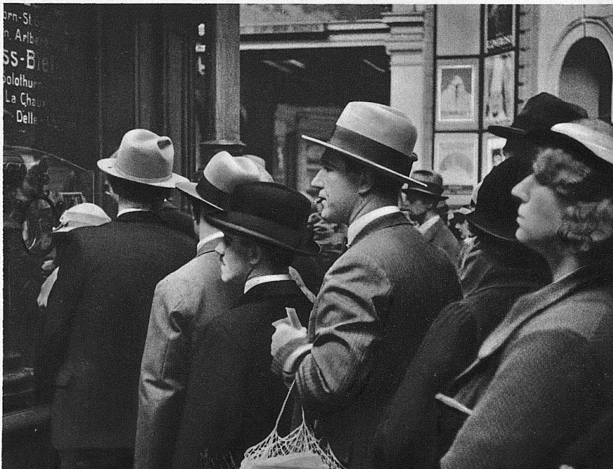
Les villes vous attendent!