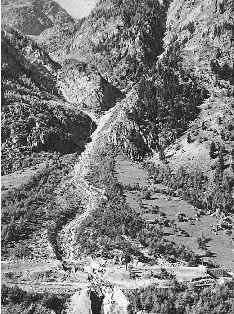
Oben: Der Blattbach und seine Lawine zerschmetterten jedes Jahr die Brücke. Ein Tunnel schützt jetzt Bahn und Geleise

Gar mancher Alpinist hat auf seinen Sommerfahrten in den Zermatterbergen die Hänge mit skilüsteren Blicken gemessen. Aber wie sollte man im Winter da hinaufkommen? Tief ist der Talpfad verschneit. Lawinen