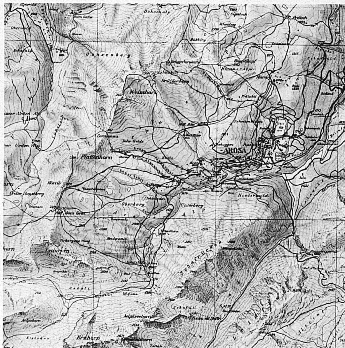
Partie de la carte de ski de la région d'Arosa (1 : 25 000), éditée par Kümmerly et Frey, Berne