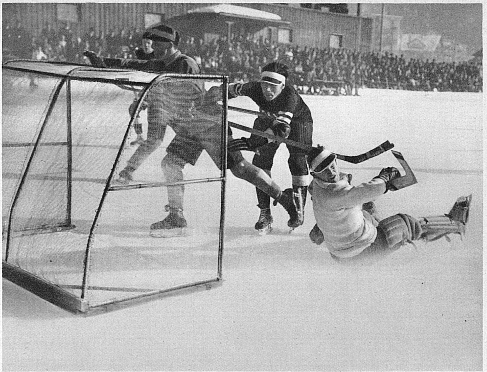
Nach heissem Kampfe wird das Tor gestürmt

Alle Ballspiele verlangen eine mög- lichst grosse Reaktionsgeschwindig- keit, ein blitzschnelles Erfassen der Spiellage. Aus Schnelligkeit, hartem Un-tergrund und der Benützung der Schlittschuhe mit ihren scharf geschlif- fenen Kanten ergibt sich nun für das Eishockey ohne weiteres eine gewisse Gefährlichkeit. Eishockey ist kein ganz harmloses Spiel! Es ist ein Kampfspiel ersten Ranges. Es ver- langt nicht nur vollen Einsatz des spielerischen Könnens, der ganzen erlernten Technik des Laufens, sowie des Füh-rens und Schiessens der Scheibe – es verlangt auch die Fähigkeit kämpferischen Wollens, des Einsatzes des Kör- pers bis zur Härte. – Und doch muss dieser Einsatz immer mit « Rücksicht » geschehen, mit dem Bewusstsein der Ge- fahr für den Gegner und für einen selbst, und mit dem Willen, diese Gefahr nach bestem Können zu vermeiden. Kurz, es muss unter allen Umständen auch im schärfsten Kampfe fair und sportlich gespielt werden. Unanständige sportliche Ausartung ist bei keinem Spiel unangenehmer für die Zuschauer, und in keinem Spiel unerfreulicher und gefährlicher für die Spieler als beim Eishockey. Und da dieses Spiel gleichzeitig « Mannschaftsarbeit » ist, Zusam- menschluss einer Gruppe von Menschen zu einem be- stimmten Ziel (« team work », wie es im Englischen heisst), da es Unterordnung und Aufgabe egoistischer Wünsche verlangt, so ist Eishockey eines der sportlichsten Spiele, die es gibt.