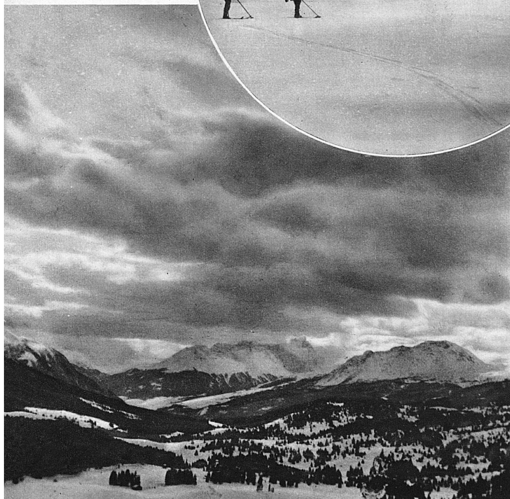
Föhn über der Lenzerheide

Die Föhnluft ist trocken, wasserdampf- arm und leckt den Schnee so gierig auf, dass die Schneepolster zusehends einschrumpfen, ohne dass die Känel einen Tropfen Wasser speien. Es er- übrigt sich, hier auf die Abarten des Föhns, den Dimerföhn, den Hoch- druck- und den Tiefdruckföhn einzu- treten. Sie gehören ins engere Gebiet der Meteorologie.