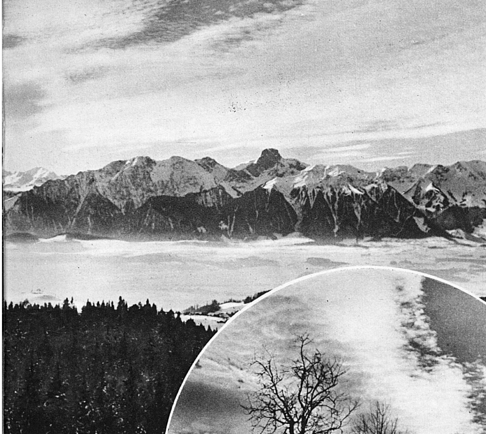
Oben: Stockhornkette von der Aschlenalp aus

Der Föhn ist kein Wüstensohn, wie man früher glaubte. Die Täler am Südfuss der Alpen haben den Nordföhn, in allen Hochgebirgen, in Skandinavien, im schlesischen Riesengebirge, in den Pyrenäen, dem Kaukasus, im Himalaya wie in den Anden kennt man den Föhn. Er weht, bläst und verheert unter andern Namen als bei uns. Der Föhn hat Altdorf, Grindelwald, zweimal Meiringen eingeschert. Er ist der grimme Talvogt, aber auch ein Wohltäter und Erlöser aus den eisigen Klammern des Winters. Seine Riesenfaust reisst die Talfenster auf und lüftet aus. Ihm verdanken die Aelpler weit ins Vorland hinaus den rechtzeitigen Einzug des Lenzes, föhnbestrichene Gegenden wie die Ufer des Vierwaldstätter-, des Thuner- und des Brienersees das milde Klima, die Abschmelzung ohne Ueberschwemmungskatastrophen. Maienfeld und