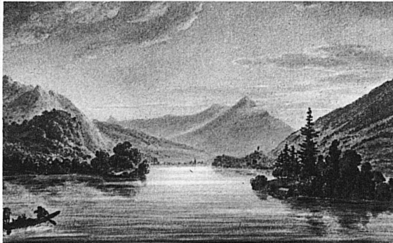
Kleine Insel im Brienzersee