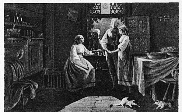
Der Kiltgang im Kanton Bern