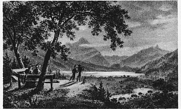
Auf einem Hügel bei Interlaken