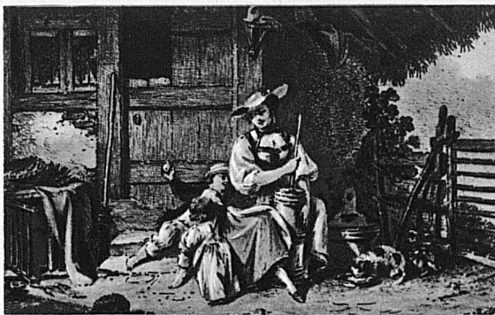
Oberländerin am Butterfass