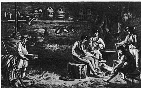
Die Fremden in der Alphütte