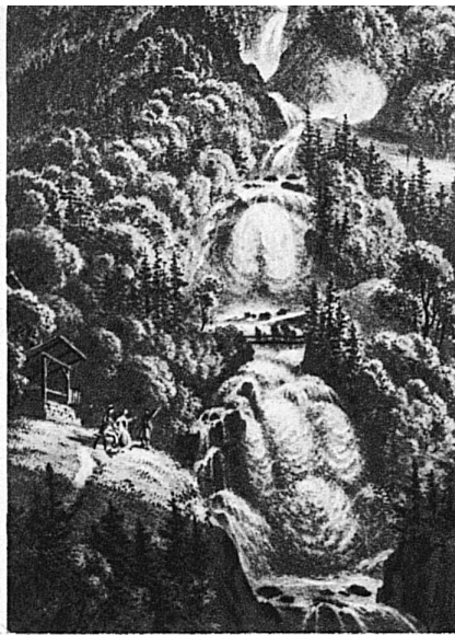
Die Giessbachfälle bei Brienz