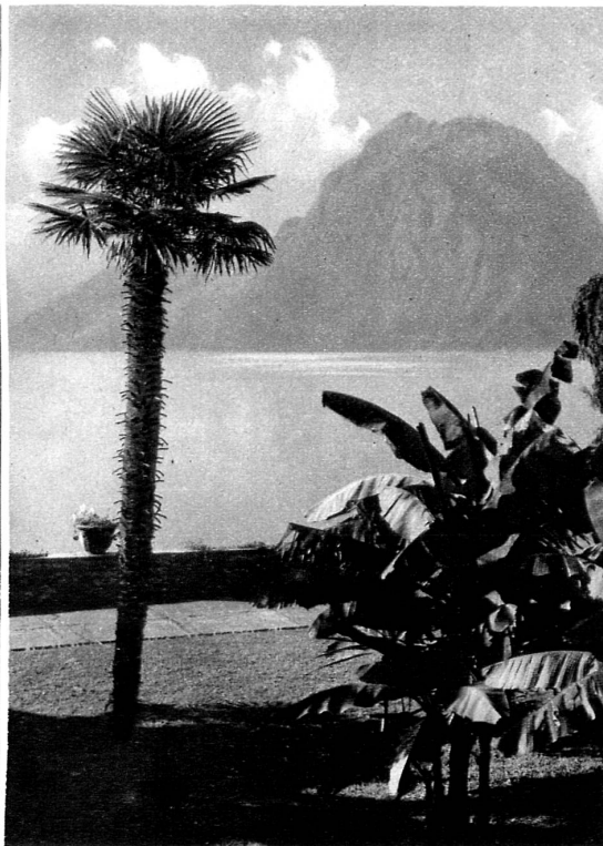
Végétation tropicale au bord du lac de Lugano

La nature a fait du Tessin un morceau d'Italie. Le peuple est de race lombarde, et son architecture donne au paysage un caractère trans-alpin. Pourtant, l'histoire et la volonté de ce peuple l'ont rattaché politiquement à la Suisse, d'une manière indissoluble. C'est parce qu'ils ont la passion de la liberté que les Tessinois sont de si ardens Confédérés. Ils sacrifient des intérêts matériels pour être Suisses. C'est une belle affirmation de la primauté du spirituel. De son côté, la Suisse a pour le Tessin une tendresse particulière, celle d'une mère pour l'enfant qui est venu le dernier et qui, par un phénomène étrange, ne ressemble pas aux autres et possède une douceur singulière. C'est pour sa grâce et sa beauté que nous vouons au Tessin un culte si fervent. C'est notre portion de soleil, notre gramme de radium. La Suisse est la somme des vertus de chaque canton. Berne a apporté la force, Bâle la richesse, Zurich le progrès, Genève l'esprit, les cantons primitifs la tradition. La contribution tessinoise au foyer commun, c'est la chaleur et la lumière.