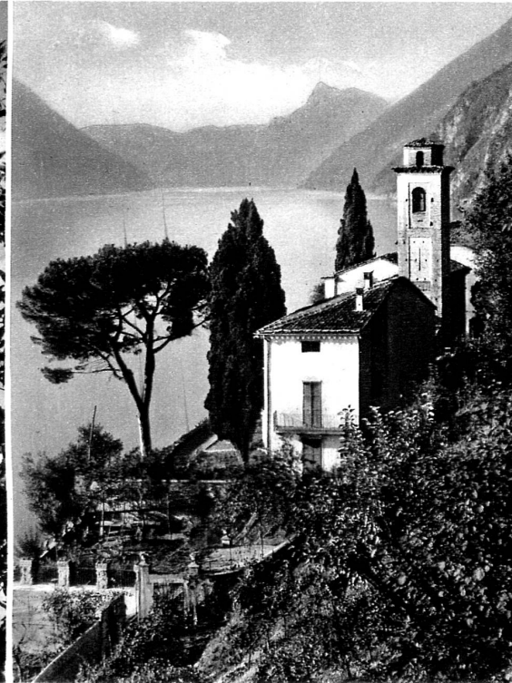
Sur les rives ensoleillées du lac de Lugano