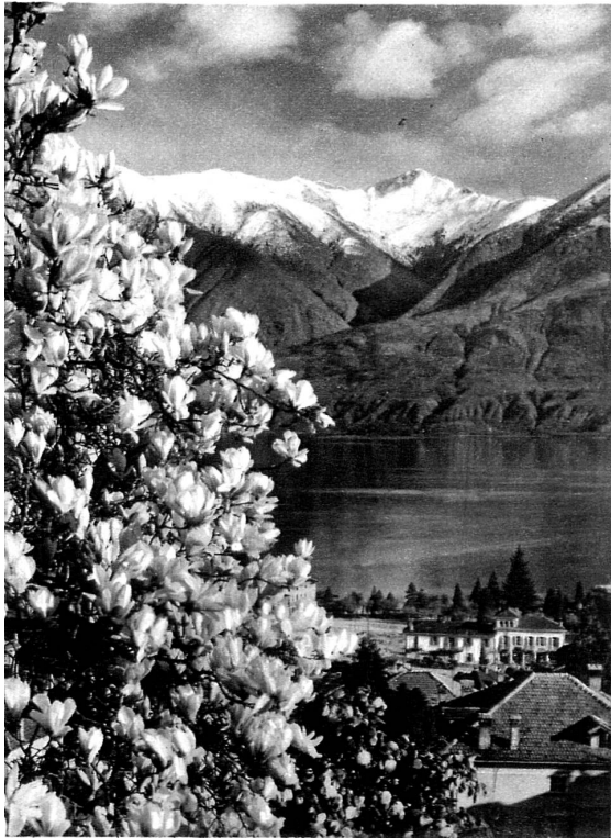
Locarno, la ville des magnolias et des camélias