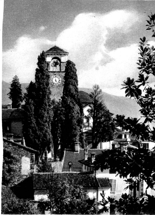
Brissago sur les bords du lac Majeur

Scène de marché au Tessin