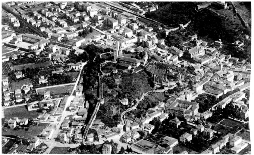
Bellinzona, la ville des châteaux