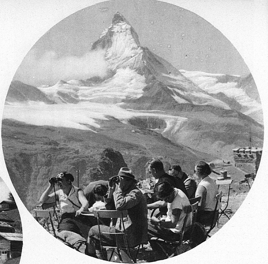
Das Matterhorn, der grosse, ferienlockende Magnet des Zermattertals