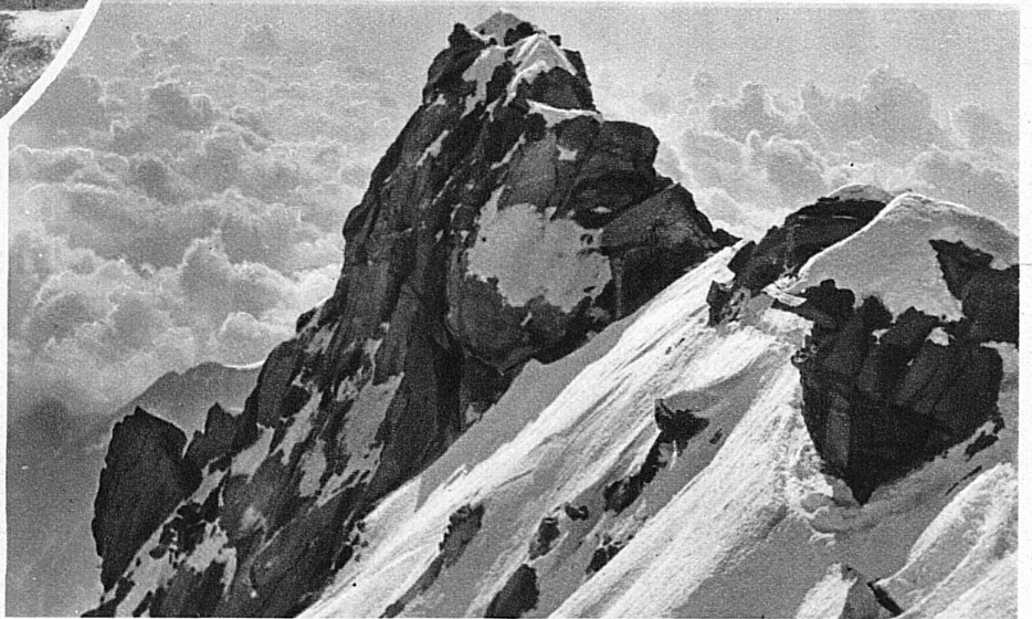
Monte Rosa. Blick von der Dufourspitze auf den Grenzgipfel Unten: Die Frauen von Evolène in der Sonntagsprozession

Die Eingänge in die Hochtäler des Wallis stehen wie riesige, spitzgestellte Dreiecke eines Ornamentes am Laufe der Rhone, deren breites Tal die romantische Reihe alter Städte vom Genfersee bis nach Brig umschliesst. Taleingänge und Städte – das Verhältnis ist ein gegenseitiges Glück. Bringen die Städte ihren Seitentälern die Welt, so halten die Täler dafür ihren Städten