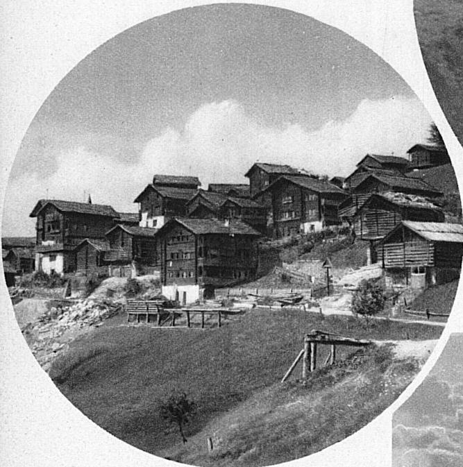
Sues im Eringertal, ein typisches Walliser Dörfchen

Die Walliser Hochtäler rufen der Welt mit dem schwerblütigen, siegesbewussten Lied ihrer Herbheit und Milde, ihrer Lichter aus goldenen Kornhalden und silbernen Firnen. Das Leuchten zeitloser Mären und Sagen breitet sich wie eine wunderbare Deutung Gottes über die alten Kirchen und verzaubert-traumhaften Kapellen, aus hundert Bergwiesen zieht gesteigerter Duft in die Dörfer, ungemessen klar werden die Blicke in Tiefen und Weiten, und die Akkorde herrlicher Farben erheben sich aus der Seele des Landes und überfließen es.