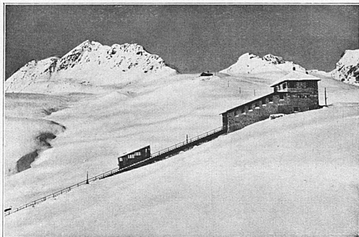
Drahtseilbahn Chantarella-Corviglia bei St Moritz, Engadin; erbaut 1928. - Oberste Station auf 2500 m Höhe ü. M.

Luzern. 19. und 26. März und 8. April: Konzerte. 30. März: Kammermusikabend. Montreux. 31 mars: Concert de l'Orchestre de la Suisse romande avec solistes. 13-16 avril: Tournoi international de tennis. 14 avril: Match international de football. 14-16 avril: Tournoi international de hockey sur roulettes. 15 avril: Tournoi de golf. 16 avril: Match de football. Dès le 15 avril: Représentation d'opérettes viennoises. 16 avril: Congrès de la Fédération internationale de patinage à roulettes. Mürren. 1. April: Skirennen. 9. April: Skirennen des Schweiz. Damenskiklubs. Mürtschengebiet. 19. März: St. Gallen-Oberländische Verbandsskitour. Olten. 25. März: Konzert der Militärmusik. 28. März: Kammermusikabend mit dem Basler-Trio. 2. April: Oratorium H-moll Messe von Bach, aufgeführt durch die Lehrgesangvereine Oberaargau und Olten-Gösgen mit dem Winterthurer Stadt-orchester. 2. April: Jodlerkonzert. Saas-Fee: 2. April: Skirennen. 17. April: Osterskirennen. St. Gallen. 23. März: Kammermusikabend. 30. März: Abonnementskonzert. 9. April: Palmsonntagskonzert.