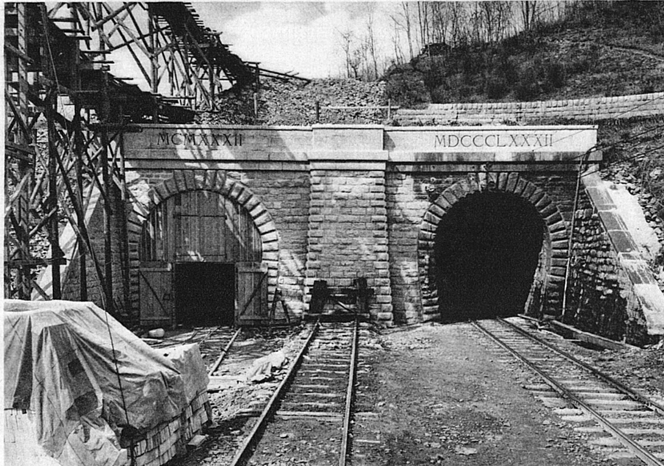
SBB Ceneri-Tunnel Südportal

3.-10. Januar: Internationales Tennisturnier auf gedeckten Plätzen. 14. Januar: Sprungkonkurrenz auf der Olympiaschanze. 23.-24. Januar: Cresta-Run-Rennen. 28. Januar, 1. und 4. Februar: Internationale Pferderennen auf dem St. Moritzersee. 29.-30. Januar: Boblet Grand prix. 2.-3. Februar: Bobletderby. 4.-18. Februar: Wintersportswoche des A.C.S. St. Gallen. 7. und 21. Januar und 4. Februar: Volkskonzerte.