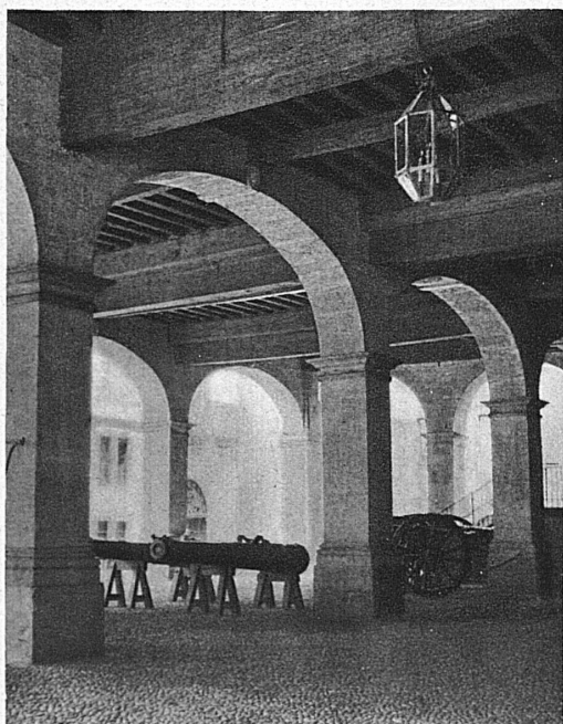
Cour intérieure de l'Hôtel-de-Ville de Genève

Les amateurs du passé, qui déplorent de voir tomber l'une après l'autre les retraites du bon vieux temps sous le balai moderne, trouveront dans Schaffhouse des consolations substantielles, des rues entières de minuscules hôtels blasonnés et balconnants, que la Renaissance construisit tout d'un souffle, et auxquels l'on n'a point changé un moellon. Et ce qui n'est point dans la rue est au Musée, dans les salles et les cloîtres du vieux couvent de Tous-les-Saints, où la cloche de Schiller retombée au silence est étrangement devenue le symbole du temps arrêté.