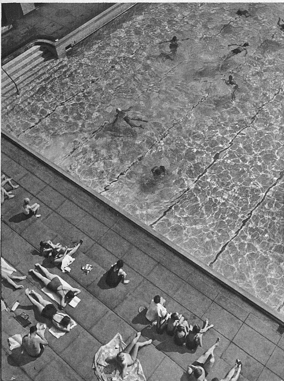
Piscine avec vagues artificielles à Berne