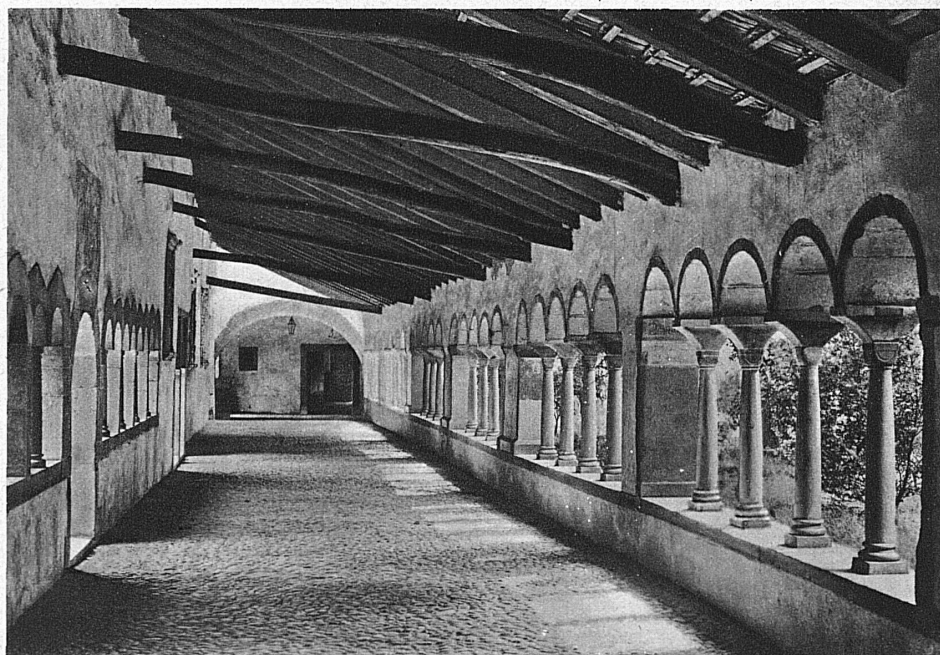
Cloître du Couvent de Tous-les-Saints à Schaffhouse