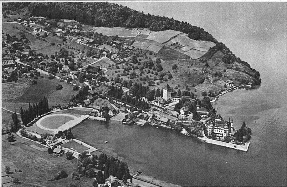
La plage de Spiez