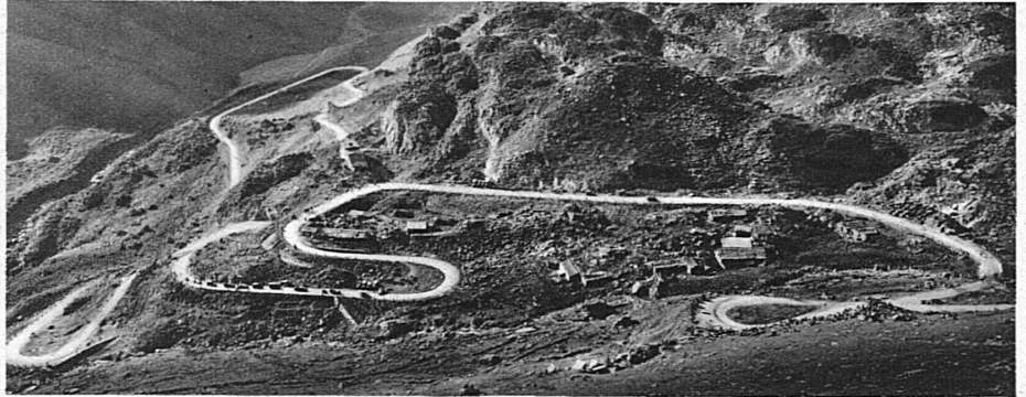
Klausenstrasse: Die Kehre der Vorfrutt

Die Vorbereitungen für die zehnte Austragung des Internationalen Klausenrennens sind bereits in vollem Gange, und es steht schon heute fest, dass es dieses Jahr eine bisher nie gekannte, qualitativ hochstehende internationale Beschickung erhalten wird; denn neben einer grossen Zahl Einzelfahrer werden alle massgebenden europäischen Firmen und Rennställe mit ihren neuesten Wagen vertreten sein. Viele hervorragende Sportwagenfahrer werden in der Schweiz einzig am Klausen an den Start gehen, da nur hier ein besonderes internationales Rennen für Sportwagen vorgesehen ist.