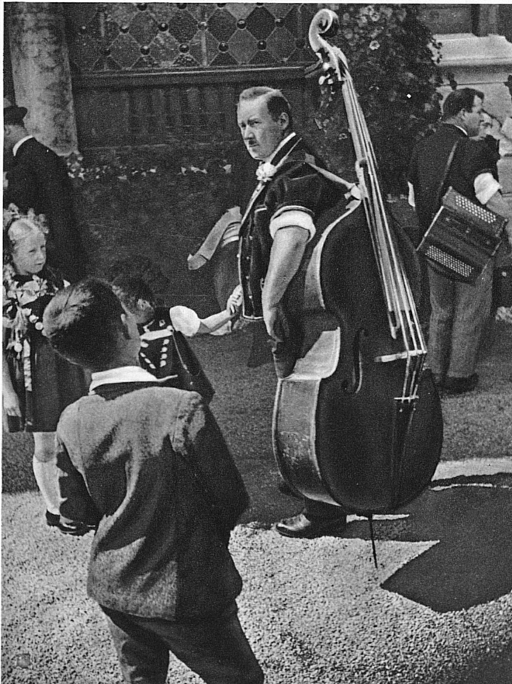
Die Ländlerkapelle rückt an... Die gewaltige Bassgeige darf nicht fehlen