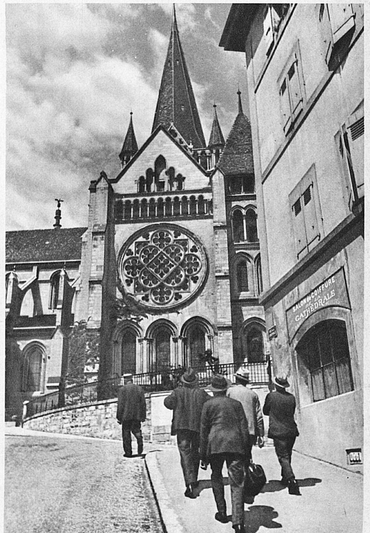
« Notre-Dame » in Lausanne ist die schönste gotische Kathedrale der Schweiz

Das Comptoir in Lausanne wird dieses Jahr zum 15. Male durchgeführt. Die neue und starke Vermehrung der Aussteller, die Erweiterung der Ausstellungsanlagen und das Hinzukommen neuer Wirtschaftszweige beweisen, dass sich das Schweizervolk nicht entmutigen lässt von der Krise und dass es in den nationalen Messen ein wirksames Mittel sieht zur Konzentration der besten Kräfte, zur Belebung des Geschäftsverkehrs. Die Idee gewinnt an Boden nicht nur bei den Ausstellern und Käufern, deren Zahl jährlich wächst, sondern auch im breiten Publikum. Das Schweizervolk hat ein lebhaftes Interesse für alles Gegenständliche, für die schönen Qualitätsprodukte seiner Industrie, seiner Landwirtschaft und seines Gewerbes. Es ergreift immer wieder gern die Gelegenheit, die Neuerungen, Verbesserungen, aber auch das Altbewährte aus eigener Anschauung kennenzulernen. Die Besucherzahl des Comptoirs in Lausanne ist von 150,000 im Jahre 1920 auf 320,000 im Jahre 1933 angewachsen.