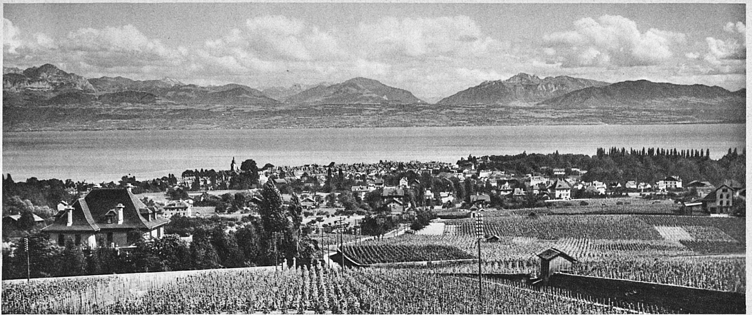
Weinberglandschaft bei Morges am Genfersee