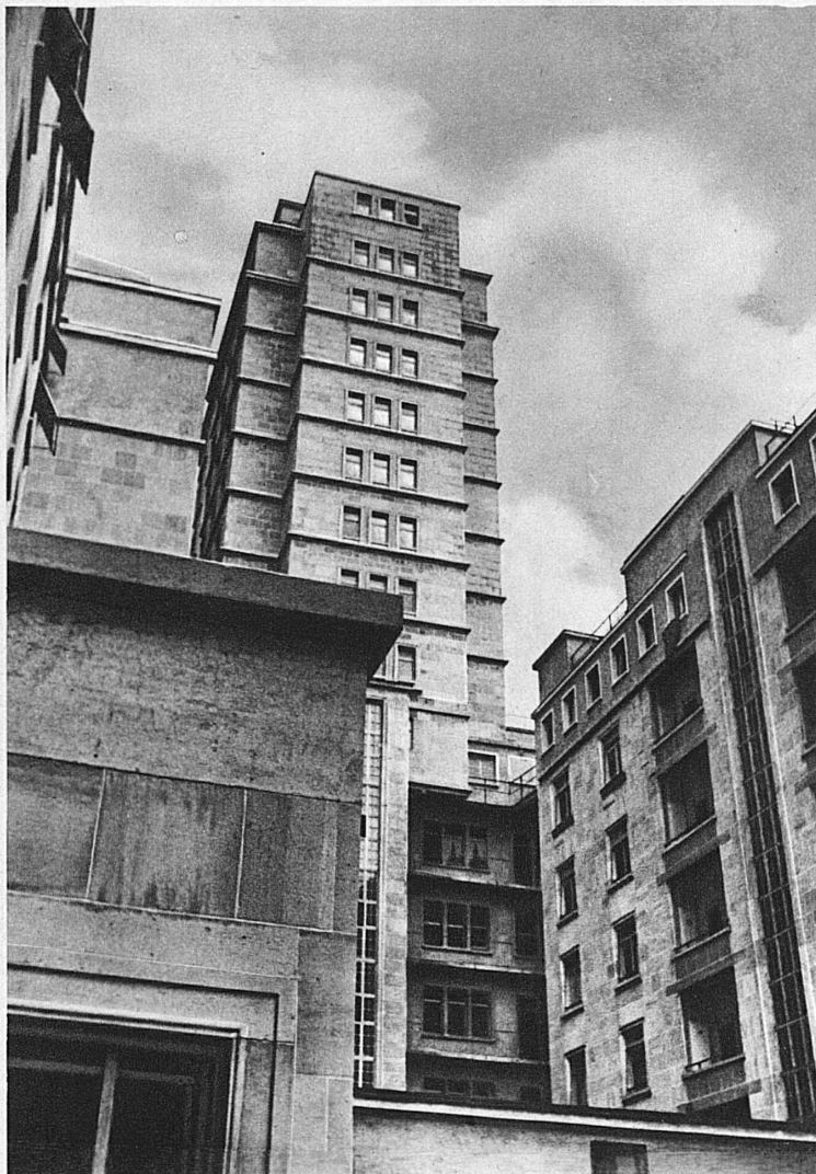
Das moderne Lausanne. Der Neubau Bel-Air

am diesjährigen Comptoir ist besonders reizvoll. Den Besuchern wird da der ganze Vorgang der schriftstellerischen Arbeit, des Druckes, der Illustration (nach den drei wichtigsten Verfahren: Offset, Litho und Autotypie), aber auch die Fabrikation des Papiers und die Arbeit des Buchbinders vorgeführt. Sie können das Tempo einer uralten und einer modernen Druckerei vergleichen. Der Schriftstellerverein hat unter den jüngern Autoren einen Wettbewerb ausgeschrieben für