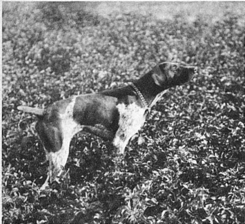
Der Hund steht vor; er hat das verborgene Wild « in der Nase » und zeigt dem Jäger die Beute an

weg, um bald wieder an verborgener Stelle, mit der Sanftheit eines herabschwebenden Flaumflöckchens, einzufallen. Dann aber mag es geschehen, dass dein Blick, selig in der köstlichen erschauernden Tiefe des Raumes sich verlierend, ungeahnt mit einem himmelhohen Segler ein Zusammentreffen erlebt, das wirklich ein Erlebnis ist. Stolzen Fluges, mit kaum wahrnehmbaren Schwingenschlägen den Körper durch den Aether treibend, als gäbe es für ihn nur noch ein Streben: Entrückung in die Höhe — prägt der Adler seine mächtigen überirdischen Zeichen in den blaufunkelnden Glask. Und unwiderstehlich die Lockung, sein gebieterischer Anruf aus der Höhe: sursum corda! Wolkensäume und Berggipfformen werden von seinen Flügelspitzen in majestätischen Kurven und Spiralen, in Volten und Sturzflügen nachgebildet. Wo anders als da