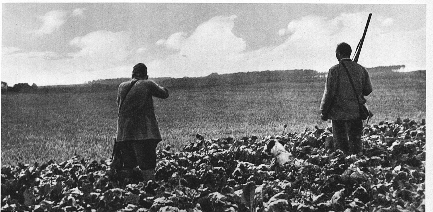
Die Rebhühner gehen hoch! Achtung, schon fällt der erste Schuss

tende Rakete erhebt er sich plötzlich bei deinem nahenden Schritt aus der Legföhren- und Erlenwirsnis und macht dir einen Gleifflug vor, wie ihn die kühnste Phantasie eines Segelfliegers kaum auszudenken vermag. Die tiefergelegenen Waldungen offenbaren dir vielleicht den urigen Ritter Urogallus, den adeligen, letzte Einsamkeiten des Bergwaldes zu seiner Wohnstätte erwählenden Auerhahn. Schreck und Erstaunen wird dich befallen, wenn der schwingengewaltige Recke sich jäh aus dem welligen Grün der Heidelbeerstauden emporwirft und mit dem Rauschen seiner Flügel alles Schweigen und Lauschen, wie von brandender Meereswoge überflutet, hinwegspült. Oben aber, wo der Waldgürtel, in letzte kleine Vorhutgruppen wetterumkämpfter Krüppelbaumgruppen gestaffelt, an das offene Gelände der Alpweiden und Bergkessel stösst, kannst du unverhofft jenes gar nicht sonderlich scheue Geflüg wahrnehmen, das im Winter ein weisses und im Sommer ein graubraunes Federkleid trägt — das Schneehuhn. Kaum vernehmbar burrend, auf leicht gebogenen Schwingen traumhaft dahingleitend, als wäre es ihm weniger um Flucht als um ein neckisches Spiel mit dir zu tun, streicht es dicht über den Boden hin-