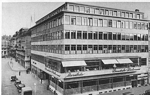
Geschäftshaus Viktoria, Zürich Architekten: Gebr. Bräm