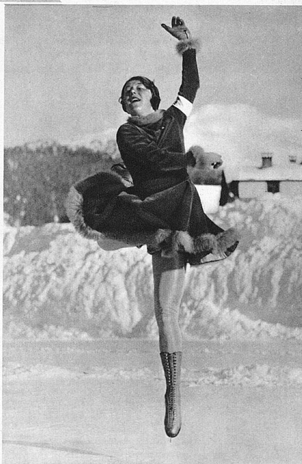
Sonia Henje, l'étoile des glaces