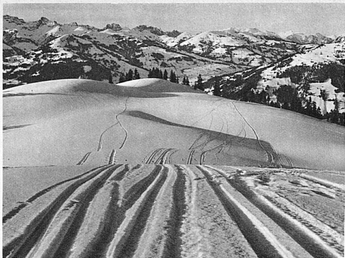
La fameuse descente en gradins de Windspillen près Gstaad