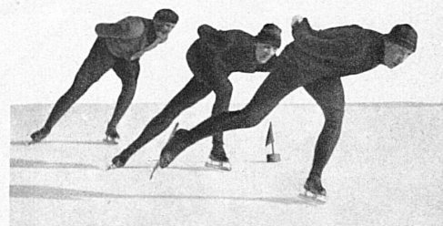
Les bolides du skating