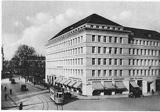
Grand Café Sihlporte, Zürich