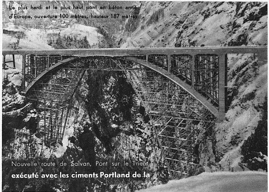
Le plus hardi et le plus haut pont en béton armé d'Europe, ouverture 100 mètres, hauteur 187 mètres

Entreprises réunies: COUCHEPIN, DUBUIS et CIE