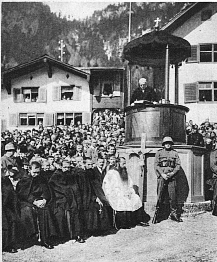
Die Kanzel beim 6. Gedenkstein, wo der Hauptkampf stattfand. Hier wird die Festpredigt gehalten

der Geschichte auf die Gegenwart an. Der Marsch führt nun von einem Gedenkstein zum andern. Beim sechsten hält, jährlich abwechselnd, ein katholischer oder ein protestantischer Geistlicher die Festpredigt. Beim Denkmal und beim elften und letzten Gedenkstein werden wieder Lieder gesungen; dann findet in der nahen Kirche ein mit Orchester begleitetes Hochamt statt. Ein Mahl vereinigt schliesslich die Behörden, während sich das Volk allerlei Lustbarkeiten hingibt.