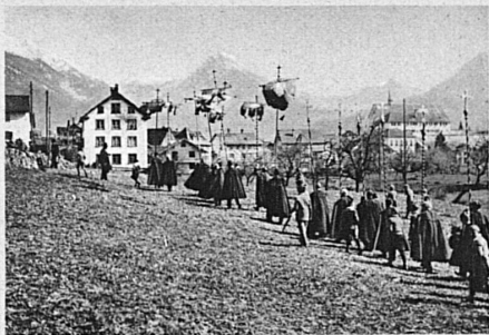
Die Prozession über das Schlachtfeld