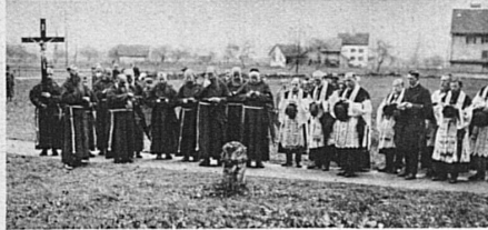
Bei jedem der 11 Gedenksteine wird kurz zum Gebete Halt gemacht

der Geschichte auf die Gegenwart an. Der Marsch führt nun von einem Gedenkstein zum andern. Beim sechsten hält, jährlich abwechselnd, ein katholischer oder ein protestantischer Geistlicher die Festpredigt. Beim Denkmal und beim elften und letzten Gedenkstein werden wieder Lieder gesungen; dann findet in der nahen Kirche ein mit Orchester begleitetes Hochamt statt. Ein Mahl vereinigt schliesslich die Behörden, während sich das Volk allerlei Lustbarkeiten hingibt.