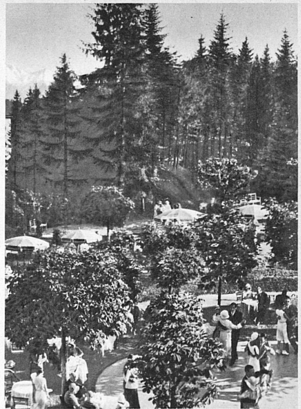
Le dancing en plein-air (Flims)