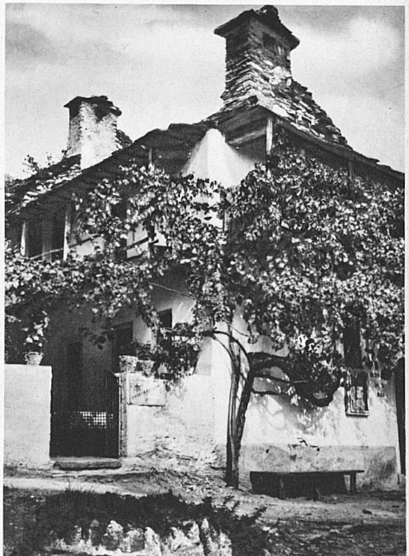
Une taverne à Orselina