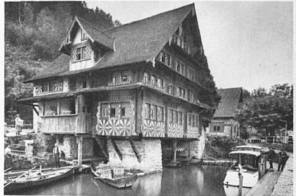
L'auberge de Treib (Quatre-Cantons)