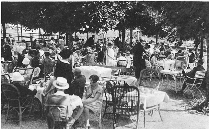
Villars à l'heure du thé