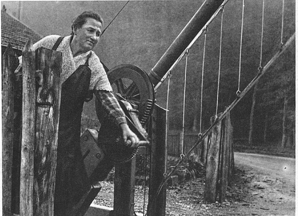
Barrierenwärterin seit dreissig Jahren und immer zufrieden

Die Draisine fährt ein. Es ist ein einfaches rotes