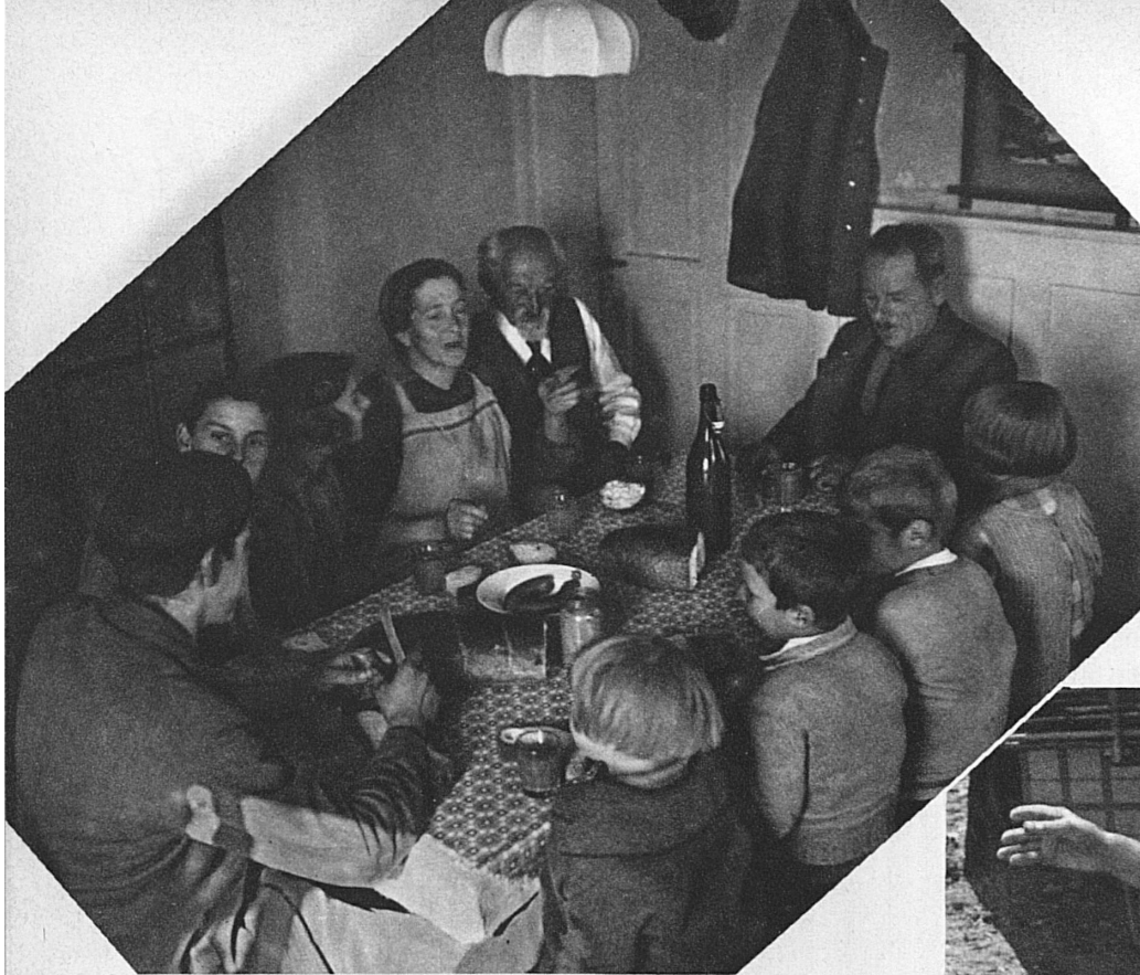
Familie Bahnwärter am Mittagstisch — aber drei der Kinder sind nicht daheim

ein schlimmes Signal, das mehrmals wiederholt wird. Es befiehlt, dass alle Züge aufzuhalten sind. (Uebrigens muss man dabei nicht immer an ein Unglück denken. Einmal hatte sich die Tür eines Apfel-Waggons geöffnet, und die schmackhafte Fracht sich über die Schienen ergossen, ein andermal sich ein Vöglein auf der elektrischen Leitung verfangen, so dass es Kurzschluss gab.) Sechsmal sechs Schläge endlich rufen den Wärter ans Telefon.