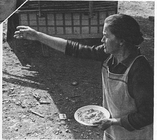
Hier streut die Wärtersfrau ihren Hühnern Futter, aber die zehn Kinder, für die sie zu sorgen hat, machen ihr mehr Arbeit

Die Draisine wird wieder aufs Geleise gehoben, ein paarmal schnauft sie ein