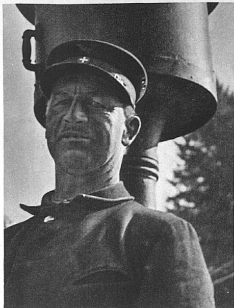
Aushilfe in der Blockstation

Fahrzeug, auf dem die Bahnmeister ihre Kontrollfahrten machen und das sich geschickt in den Fahrplan einschmuggeln muss, um nicht von den mächtigen Zügen überrannt zu werden. Im ratternden Lärm verstehen wir nur, dass unser erster Besuch einem Bahnwärter gilt, der Vater von zehn Kindern im Alter von vier bis zwanzig Jahren ist.