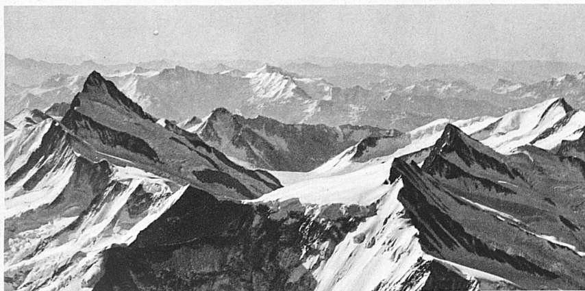
Finsteraarhorn und Grindelwaldner Fiescherhörner

land während der Winterszeit reges Leben. Wenn die kalten Monate ihren Riesentmantel um die Berge legen, dass er in die tiefen Täler niedergleitet, alle harten Formen brechend, dann öffnen die heiligen Gaststätten die sonnigen Fenster, und Tausende, die in nebligen Niederungen wohnen, streben unentwegt der Höhe zu. Im Dorf, am Talhang, überall beginnt ein frohes Treiben. Spur legt sich an Spur. Der unaufhaltsam gleitende, eilende Skilauf überflügelt sämtliche Rivalen auf dem Gebiet winterlicher Betätigung. Wo einst allein der zähe Bergbauer, der schlaue Jäger, der Holzfäller mit seinem Schlitten mühsam durch den tiefen Schnee