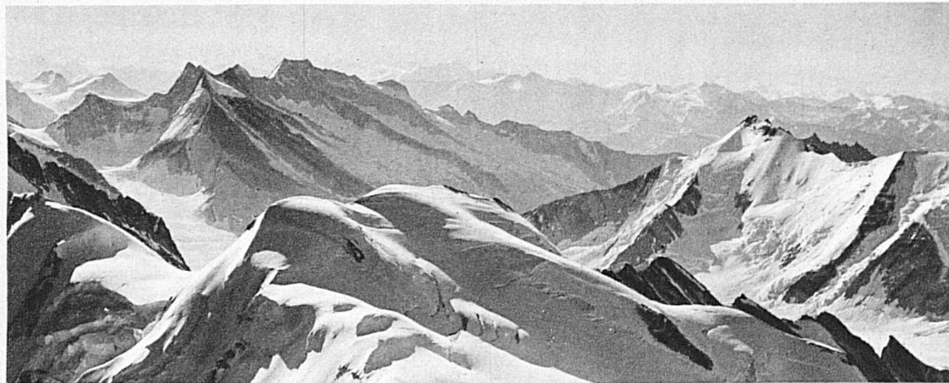
Berner Hochalpen : Ebnefluh, Fiescherhörner, Dreieckhorn