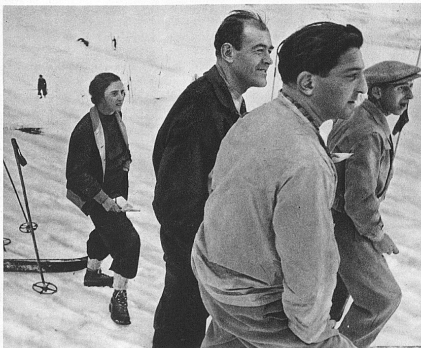
Die Argusaugen. Trainingswochen der schweizerischen Skikanonen in Mürren

land während der Winterszeit reges Leben. Wenn die kalten Monate ihren Riesentmantel um die Berge legen, dass er in die tiefen Täler niedergleitet, alle harten Formen brechend, dann öffnen die heiligen Gaststätten die sonnigen Fenster, und Tausende, die in nebligen Niederungen wohnen, streben unentwegt der Höhe zu. Im Dorf, am Talhang, überall beginnt ein frohes Treiben. Spur legt sich an Spur. Der unaufhaltsam gleitende, eilende Skilauf überflügelt sämtliche Rivalen auf dem Gebiet winterlicher Betätigung. Wo einst allein der zähe Bergbauer, der schlaue Jäger, der Holzfäller mit seinem Schlitten mühsam durch den tiefen Schnee