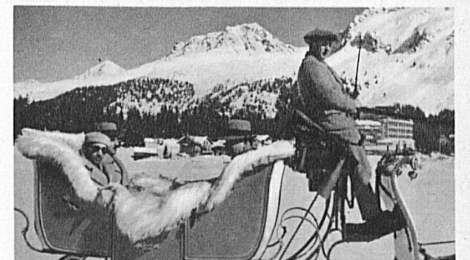
Prinz Nawab Muazzam Jah Bahadur von Hyderabad in Arosa

Der Zweck der Seva-Lotterie ist gemeinnützig. Der Reingewinn dient der Arbeitsbeschaffung aller Art, der Förderung des Fremdenverkehrs, dem Naturschutz und ähnlichen Zwecken. Die Lotterie ist vom Regierungsrat des Kantons Bern bewilligt, und ihre Durchführung ist wiederum garantiert durch die Kantonalbank von Bern.