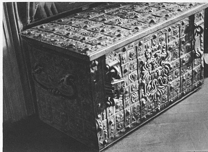
Eine der prunkvollen alten Stationskassen

Dass sich nicht nur die Geschwindigkeiten unterdessen geändert haben, sondern auch der Komfort des Reisens, zeigt ein Querschnitt durch drei Coupés III. Klasse. Das Abteil im Jahre 1870: ein eiserner Kanonenofen steht in der Ecke, ein Petroleumlämpchen ist zwischen zwei Abteilen in die Wand eingelassen, über den engen Fenstern ist der Gepäckhalter angebracht, und ein Verbot, nämlich in den Wagen zu spucken, zierte die Wand. Im Jahre 1890 sind aus dem einen Verbot ihrer fünf geworden, dafür ist die Petrolfunzel der Gasbeleuchtung gewichen, und der eiserne Ofen von der unter der Bank liegenden Dampfheizung verdrängt worden. Im Abteil des Jahres 1930 endlich, das natürlich über elektrische Beleuchtung und elektrische Heizung verfügt, ist die unfreundlich-dunkle Färbung des Holzes einer hellern Tönung gewichen und die Fenster sind breit und licht geworden. Von den fünf Verböten sind nur noch zwei übriggeblieben, an Stelle der verschwundenen hängt die Photo einer freundlichen Schweizerlandschaft an der Wand. Wir wollen mit diesen Beispielen, die wahllos aus der Fülle genommen sind, nur zeigen, in welchem Geist das Museum gehalten ist. Dass daneben der Ingenieur, der Techniker, der Architekt in den Entwürfen, Modellen und Apparaten mehr sehen wird als der Laie, bedarf keiner Erwähnung. Aber ein Museum soll allen etwas bieten — und das erfüllt die Sammlung im Zürcher Güterbahnhof in reichem Masse. E. G.