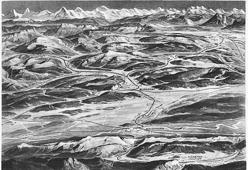
Blick von den Jurahöhen des Weissensteins nach Süden - Ausgangspunkte: Stationen Gännsbrunnen und Oberdorf (Solothurn) - Autokurs Gännsbrunnen-Weissenstein. Sonntagsbillette zu reduzierten Preisen

Wie die Kunstturner und die Leichtathleten werden nun auch die Nationalturner ihre Meisterschaftswettkämpfe haben. Erstmals am 2. Juni 1935 soll in Luzern je ein Meister auserkoren werden im Gruppenwettkampf in Kategorie A und B, im Einzelzehnkampf und in den Spezialübungen Steinstossen aus Stand und mit Anlauf, im Hochweitsprung und in den Freiübungen. Die grösseren Unterverbände stellen eine Gruppe von 13 Mann in Kategorie A. Die