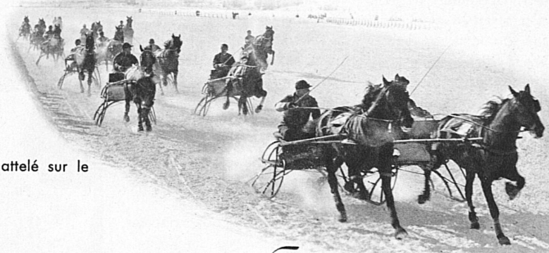
Course de trot attelé sur le lac de St-Moritz