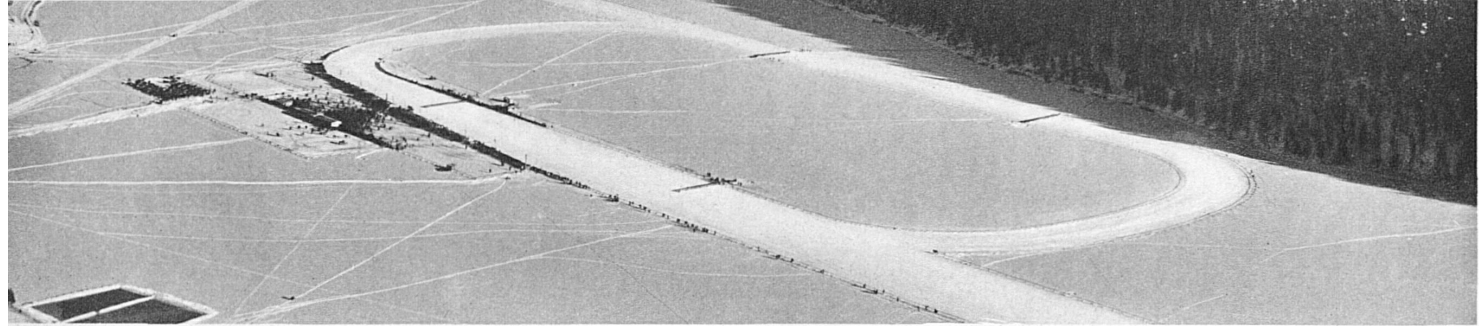
La piste des courses du lac de St-Moritz