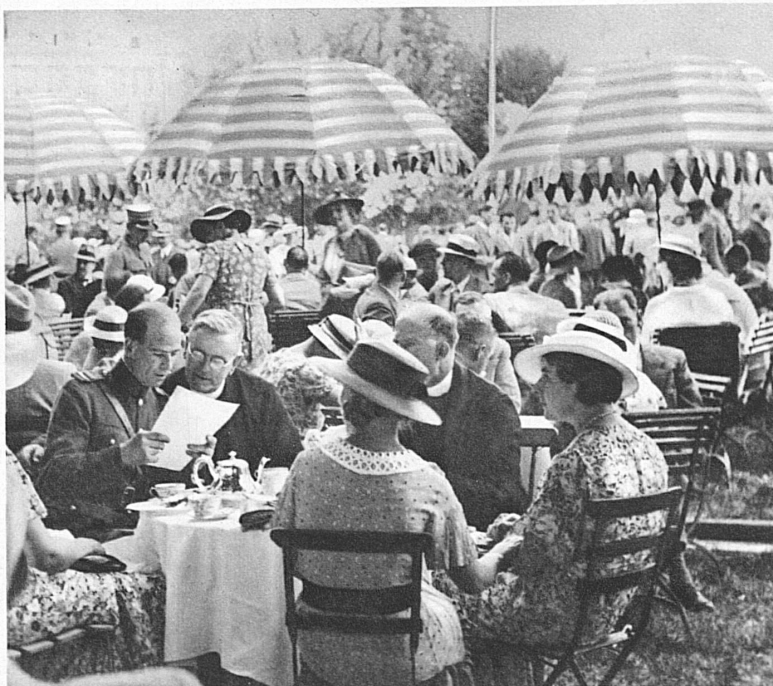
Das Tribünenbuffet während der Pause