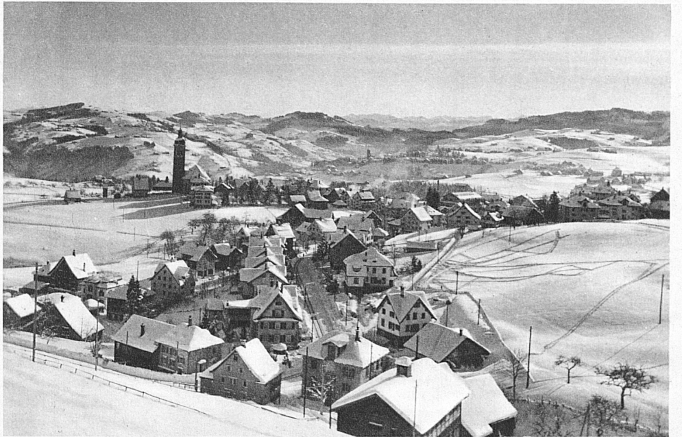
Speicher im Kanton Appenzel

Wenn vom Spätherbst an eine dicke Nebeldecke sich wochenlang über dem Tiefland lagert oder nasser Schnee zerstampft und unrein auf allen Gassen und Strassen der Stadt liegt, wenn der Himmel auch an schönen Tagen wie mit einem russigen Schleier überzogen ist, dann strahlen unsere Höhen und Bergtäler in einem schneeweissen Gewand gegen einen tiefblauen, in unendliche Weiten sich wölbenden Himmel. Und dieser Mantel glitzert in der Sonne von Myriaden Diamanten, die das Licht in allen Farben des Spektrums zurückwerfen. Jetzt kriechen sie von allen Seiten aus dem düstern Grau ins sonnige Bergland hinauf, die schwarzen Schlangen der Sportzüge, angefüllt bis auf das letzte Plätzchen mit licht- und luft-hungrigen Menschen aus jenen Großstädten, wo es im Winter kaum Tag wird. Die Gepäckwagen starren von mehr oder weniger elegan-