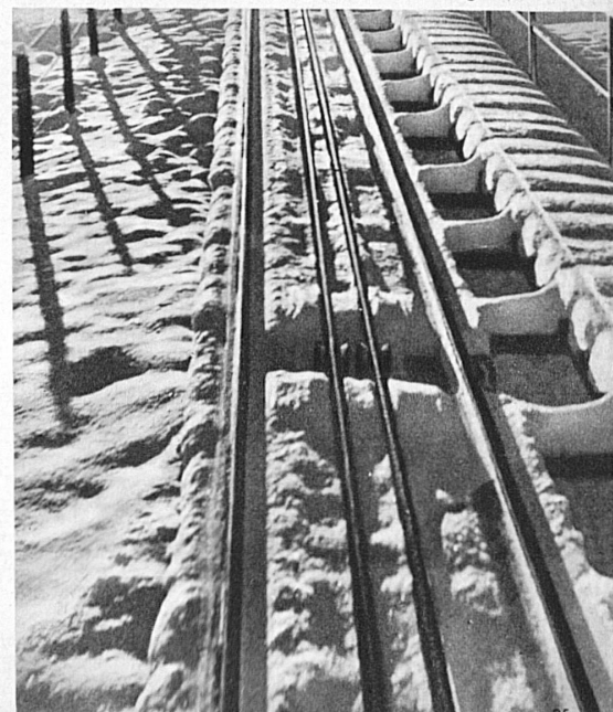
Unten: Unterwasser—Illios, die neue Bergbahn