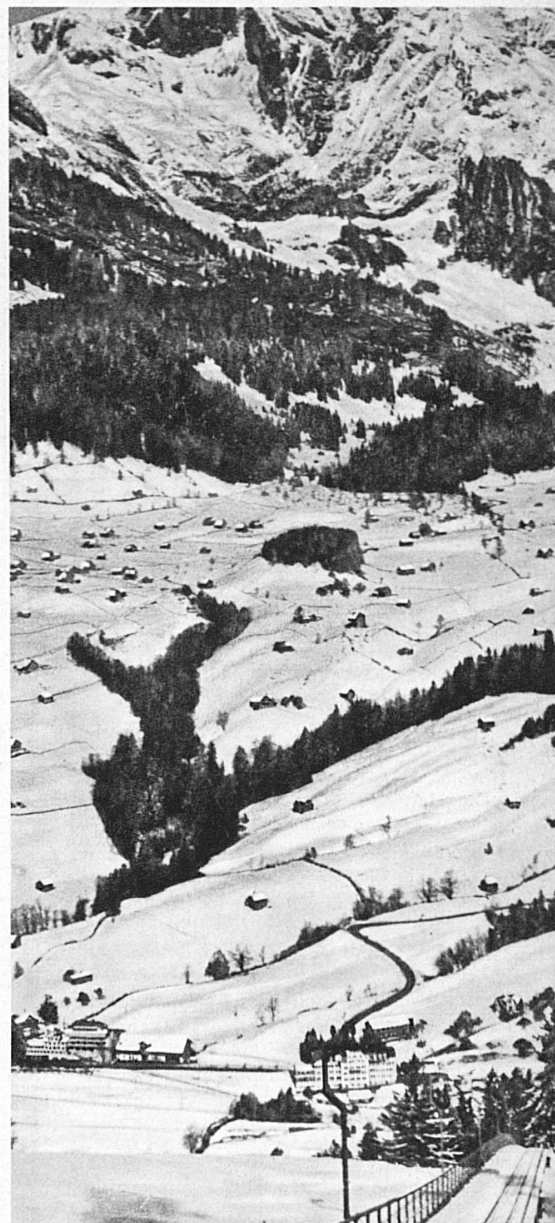
Oben: Toggenburg, das typische Land der Einzelsiedlung. Bei Unterwasser