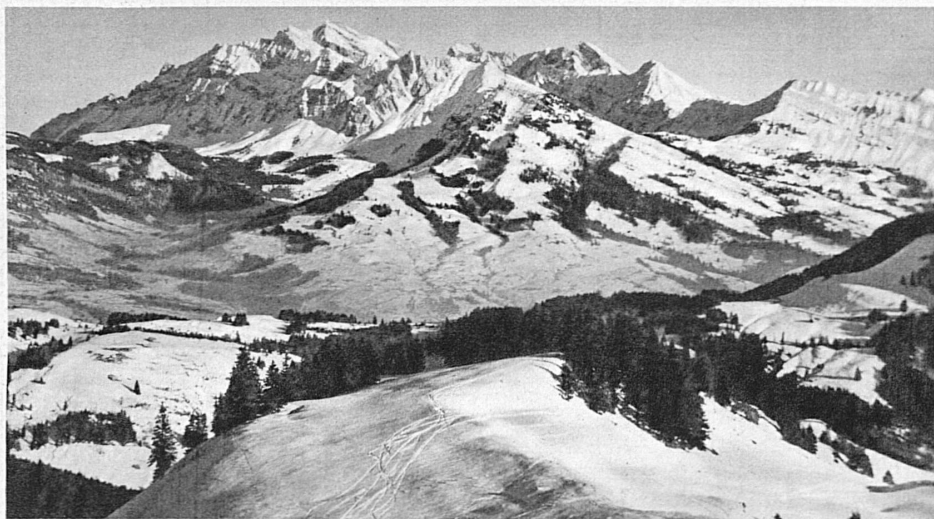
Der Säntis vom Tanzboden aus