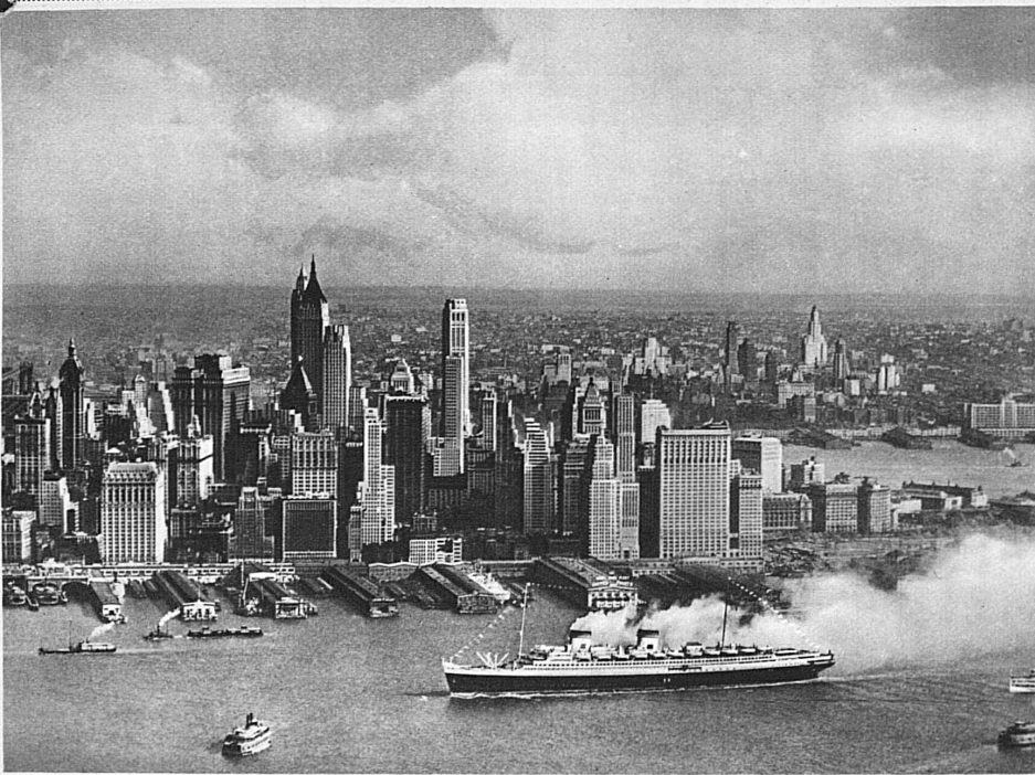
Der Superexpressdampfer „Rex“ im Hafen von New York