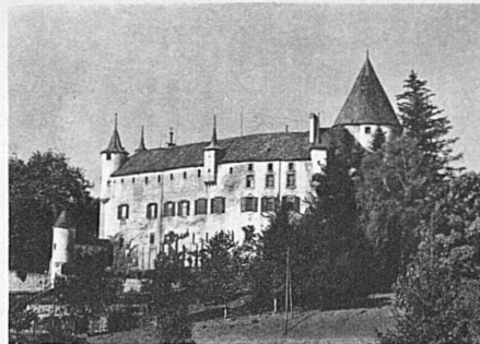
Schloss Oron in der Waadt

Installationsmaterial für elektrische Freileitungen • Krane aller Art und Verladeanlagen • Baumaschinen • Transportanlagen • Schützen für Stauwehre und Turbinenanlagen