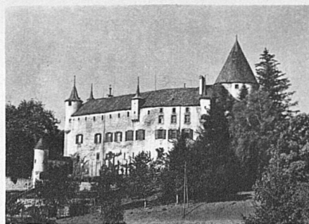
Schloss Oron in der Waadt

Installationsmaterial für elektrische Freileitungen • Krane aller Art und Verladeanlagen • Baumaschinen • Transportanlagen • Schützen für Stauwehre und Turbinenanlagen