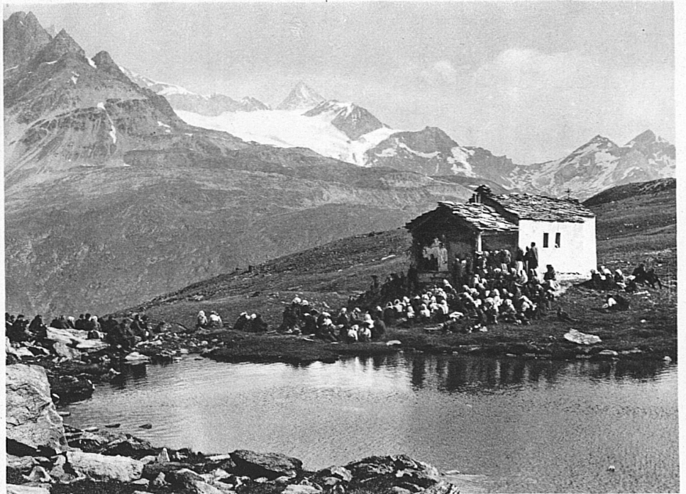
Die Kapelle Maria zum Schnee am Schwarzsee bei Zermatt

Wenn der Reisende von Norden her den Alpen entgegenfährt, so sind ihm die ersten sonngebräunten Blockhäuser, die «Schweizerhäuser», die im Urnerbiet von den steilen Talhängen heruntergrüssen, ein Zeichen dafür, dass er jetzt im Gebirge ist. In der Tat ist diese Bauart charakteristisch für die ganze