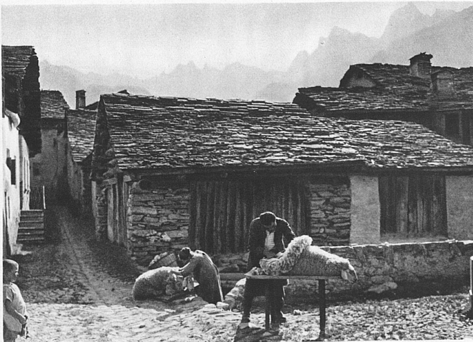
Schafschor in Soglio im Bergell

Noch mehr als die Bauart sind die alpinen Wirtschaftsformen von der allgewaltigen Natur diktiert. Die höhern Gebirgslagen, die nur noch einen kärglichen Rasen hervorbringen, erlauben nichts anderes mehr als ausschliessliche Milchwirtschaft. Wo es aber die Bewohner solcher Gegenden noch wagen, Aeckerchen an den Bergflanken anzukleben, da werden sie von der Natur gezwungen, wie vor Jahrtausenden die Erde ausschliesslich mit der Hacke zu bearbeiten. Mit der Sichel muss das Getreide, bevor es reif ist, geschnitten werden: an haushohen Gestellen wird es vor dem allzu früh drohenden Winter zum Ausreifen aufgehängt. Die Kartoffeln werden mancherorts kniend gegraben, und die kostbare Erde muss, wenn sie abrutscht, in Körben und