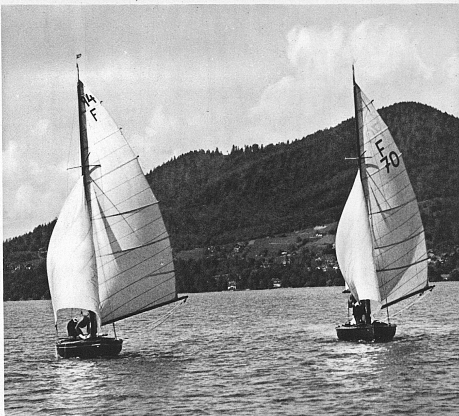
Herrliche Seen bringen reiche Abwechslung in die schweizerische Landschaft. Auf dem Thunersee, zwischen Berner Oberland und Mittelland, ist dieses Jahr eine Segelschule eingerichtet worden