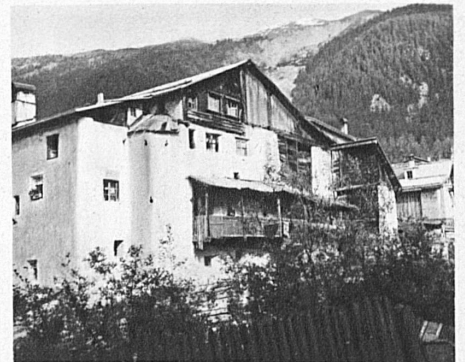
Santa Maria. Häuser an der Muranza