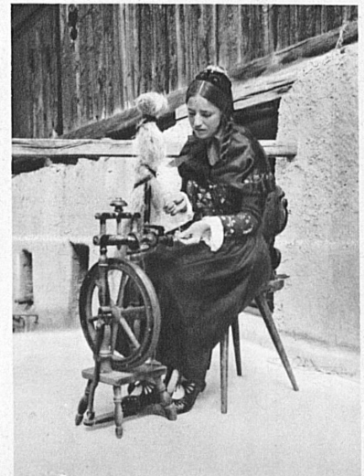
Handweberei Münstertal. Am Spinnrad. (Tracht engadinisch.)

« Lasse deine Neider neiden, deine Feinde lasse hassen! Was der gute Gott dir gönnt – niemand kann dir dieses nehmen. » (Hausspruch in Valcava.)