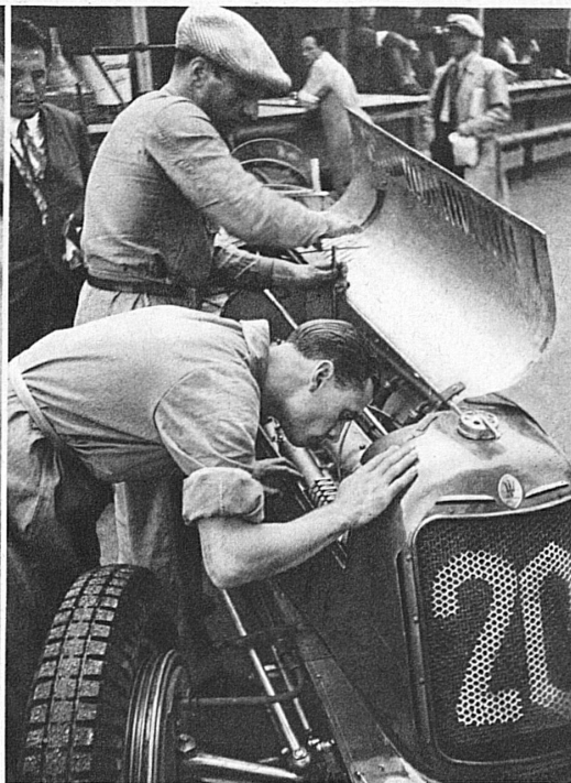
Dernier coup d'œil au moteur