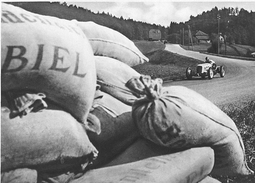
Les sacs de sable protecteurs