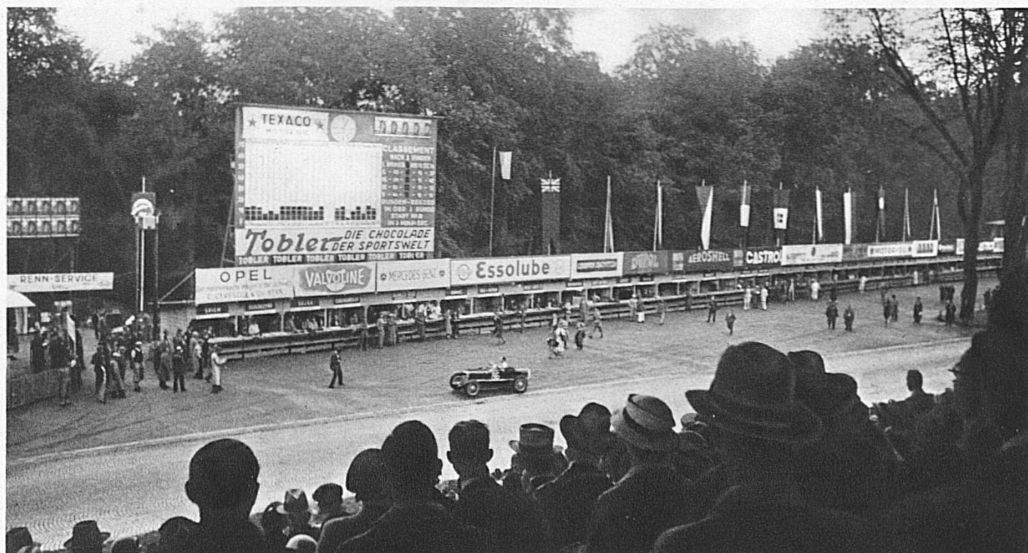
Coup d'œil depuis les tribunes centrales sur la piste et le tableau d'affichage