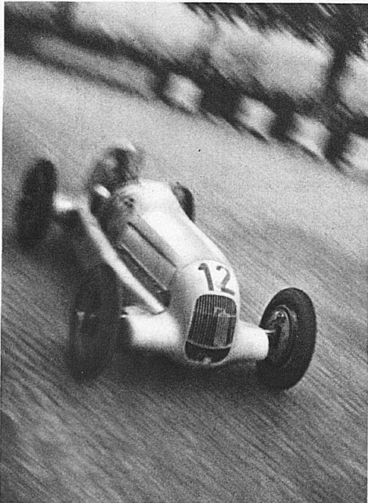
En pleine course