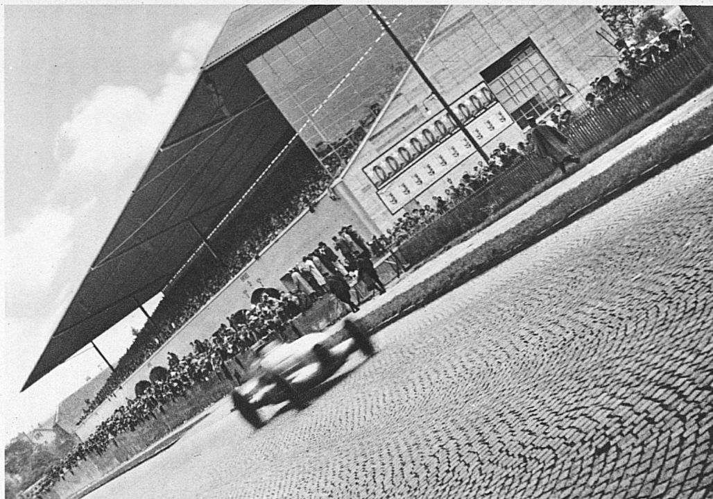
Les grandes tribunes au virage de Bremgarten