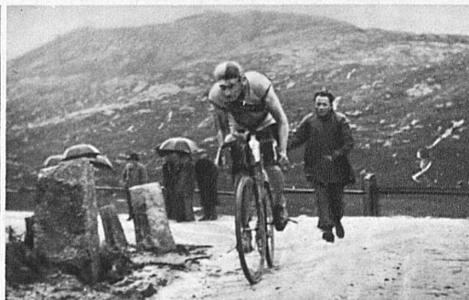
Dans les lacets du Saint-Bernardin

Là, nos hommes auront un jour de repos. Puis, remontant en selle, ils gagneront par le Brünig, le Lac de Thoue et la vallée de la Simme, la Suisse Romande que leur livrera le Col des Mosses. Traversant Montreux, Vevey, Lausanne, ils arriveront que celui-là ?