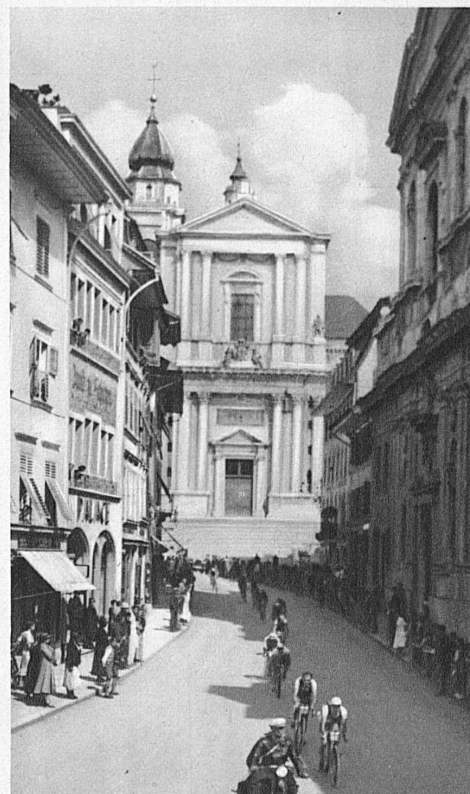
Traversée de Soleure

Le jour suivant, nous montons à l'assaut du Saint-Gothard, qui est à 2095 mètres au-dessus du niveau de la mer. Ensuite, c'est la folle descente jusqu'au Lac des Quatre Cantons, la