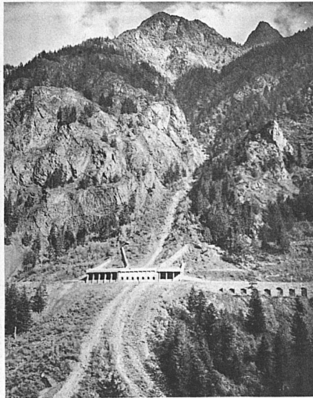
Lawinenschutzbauten an der Südrampe der Lötschbergbahn

So schön und verführerisch der Thunersee ist, auf die Dauer ist doch der Lockruf der Blümlisalp noch stärker, und kein Weg dorthin ist kürzer, und kein Weg vor allem ist schöner als die Fahrt mit der Lötschbergbahn von Spiez talaufwärts dem Laufe der Kander entgegen. Man mag in Reichenbach aussteigen und durch das tannendunkle Kiental sich der «Weissen Frau» nähern oder in den schönen Wagen der Bahn sitzen bleiben und auf fesselnd angelegter Steilrampe bis Kandersteg fahren, immer wird man den Entschluss loben, dem Lockruf gefolgt zu sein und sich in den Machtbereich des strahlenden Berges begeben zu haben. Von Kandersteg, diesem 1200 Meter hoch gelegenen Sportplatz, erreicht man leicht den Oeschinensee, und wer es einmal erlebt hat, wie dort steil und gewaltig die herrliche Felsgestalt aus dem farbenschühenden Wasser des Bergsees aufragt, der wird es kaum je mehr über sich bringen, in Kandersteg vorbeizufahren, ohne den Oeschinensee zu besuchen. Allerdings wird die Treue zum Lötschbergzug schon vor Kandersteg auf eine harte Probe gestellt; denn unmittelbar bevor die Bahn den Talgrund der Kander auf dem mächtigen Viadukt überschreitet, öffnet sich in Fruti-