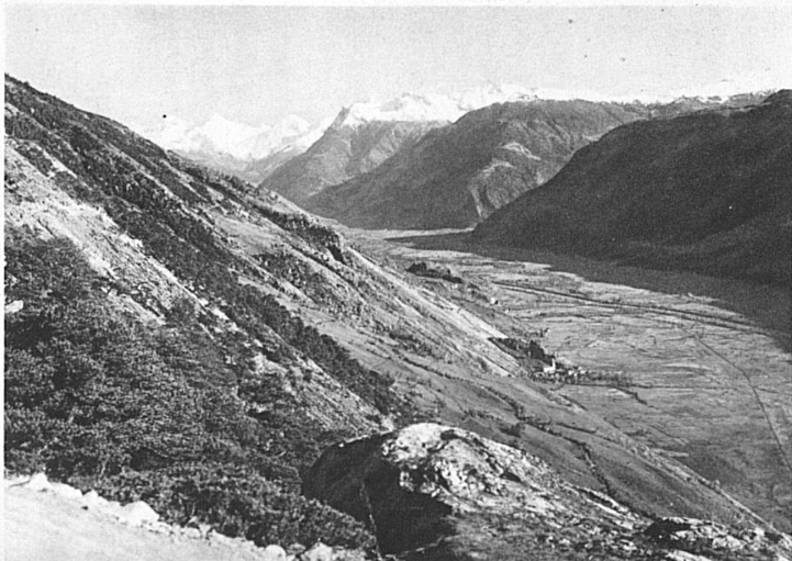
Blick von der Lötschbergbahn auf das Rhonetal gegen den Simplon