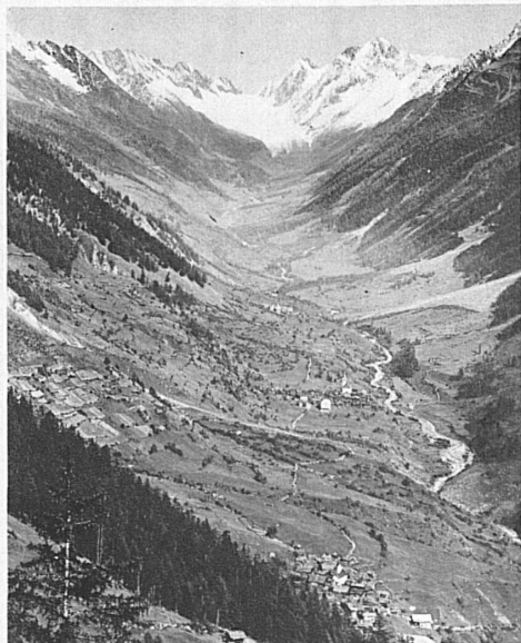
Blick auf das Lötschenttal mit der Lötschenlücke im Hintergrund

Thun mit seinem herrlichen See, der nach Westen weit offen ist und den Himmel hellblau spiegelt, dessen östliche Hälfte, zwischen hohen Bergen liegend, düster wäre, wenn nicht von oben der unwahrscheinliche Glanz der Viertausender sein Grün aufhellen würde, Thun mit seinen Rosengärten und alten Schlössern, mit seinen Segelbooten und Dampfschiffen, mit dem ganzen Reichtum seiner Ausflugsmöglichkeiten ist eine Overtüre von solcher Pracht, wie sie sich nur eine Reiseroute mit den Steigerungsmöglichkeiten der Lötschbergbahn unbeschadet leisten kann.