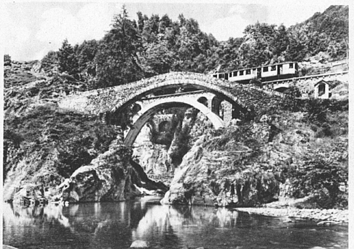
Im brückenreichen Tal der hundert Schluchten, im Centovalli