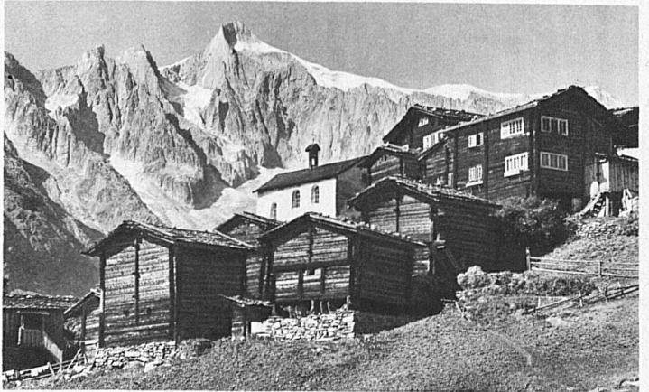
Ried, eines der kleinen, malerisch an den Hang geschmiegt Wal-liser Dörfchen