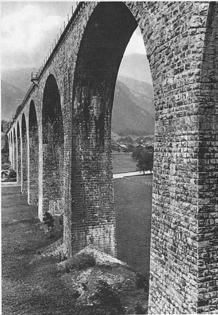
Grosser Viadukt der Lötschbergbahn im Kandertal bei Frutigen