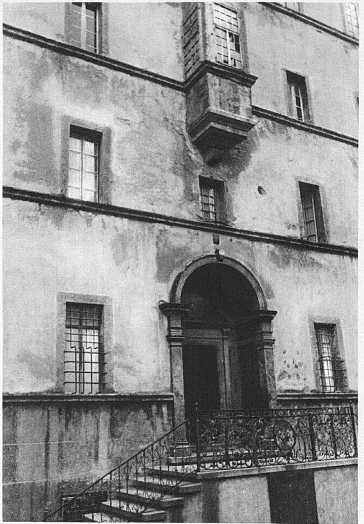
Detail des Stockalperpalastes in Brig