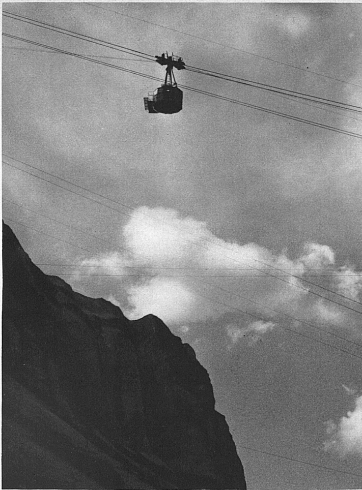
Hoch, hoch in freien Lüften, doch sicher hängt die Kabine am starken Drahttau