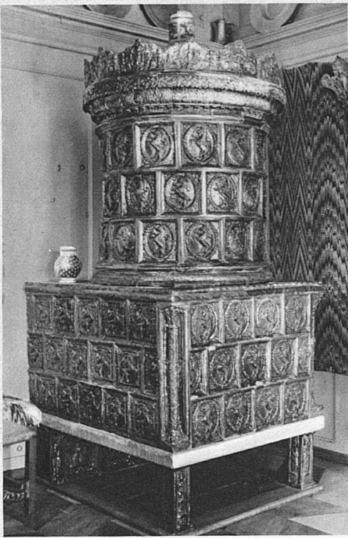
Rhätisches Museum in Chur: Ofen mit glasierten grünen Reliefkacheln. Erste Hälfte des 17. Jahrhunderts

Und diesem friedsam-häuslichen Temperament entspricht auch, was er zu erzählen hat: in der Malerei, mit der die Meister seine glatten Wände zierten, ist nichts Hintergründiges und verdächtig Dämonisches, es ist eine ehrbare, von soliden Grundsätzen geleitete Welt; alles, was dargestellt wird,