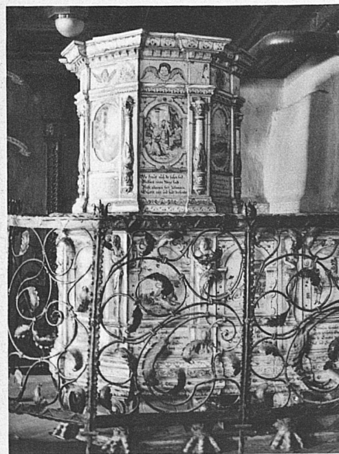
Ratsstube Malans. Bunt bemalter Turmofen von David Pfau in Winterthur 1690