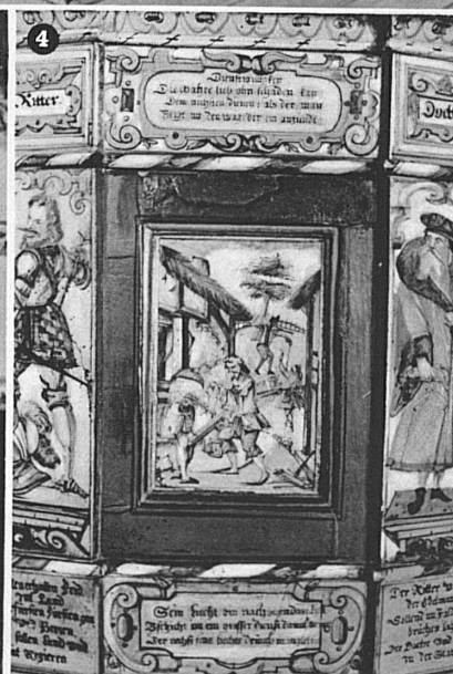
4 Detail des Ofens in der Churer Bürgerstube