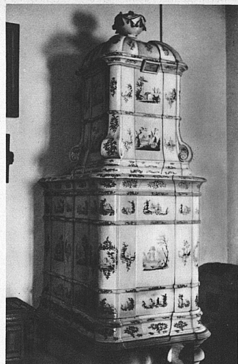
Schweizerisches Landesmuseum. Kuppelofen mit Sepiamalerei aus Zürich. Zweite Hälfte des 18. Jahrhunderts

Mit dem Ende des 18. Jahrhunderts begann diese einfallsreiche Kunst langsam zu versiegen. Immer mehr hatte sich schon die Vielfarbigkeit aus dem Dekor herausgeschlichen und das helle Blau auf dem weissen Grund allein zurückgelassen; dann wichen die Bildchen den einfachen Girlanden, und schliesslich liess man es an der unbemalten Fläche genug sein. Die auf das Feierliche gerichtete Neigung für das « Antikische » vertrug die harmlosen « Divertissements » nicht mehr. Und es ist nun hübsch, zu beobachten, wie der vom städtischen Ofen vertriebene Bilderschmuck in der ländlichen Abgeschiedenheit ein Reservat fand, so wie bisweilen in der Stadt aus der Mode gekommene Kleidungen und Möbel dort noch lang ein rührend verschollenes Dasein führen. So spannt etwa die Familie Löttscher im bündnerischen St. Antönien lustig die alte Bilderfreude weiter und pinselte auf cremefarbenem Grund in heitern Farben mit mehr Liebe als Gelingen Pflanzen und Blumen, Häuschen und Burgen und Menschen und Tiere ihrer bäuerlichen Umwelt.