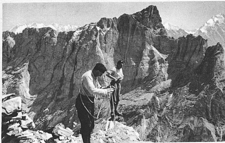
Der königliche Bergsteiger auf dem Kl. Wellhorn

Das Aperwerden der Engelhörner, der klassischen Kletterberge des Oberhasli, mahnt Meiringen zum zweiten Male daran, dass ein hoher,