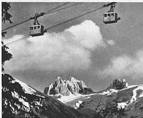
Luftseilbahn Gerschnialp-Trübsee mit Spannörter

Die Arbeit der Zürcher Rover hat sich reichlich gelohnt. Neue Freunde hat die Schweiz gewonnen, alte Freundschaften wurden wieder gefestigt. Nach dem Lager auf Ingarö reisten verschiedene Trupps, wie die Oesterreicher, Rumänen und etliche Engländer direkt nach der Schweiz, um hier den Rest ihrer Ferientage zu verbringen. alb.