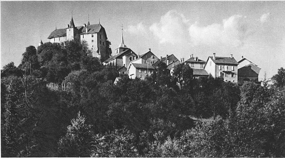
Rue, dans la Broye fribourgeoise, à l'écart de la grande circulation, règne paisiblement sur les bois et les champs