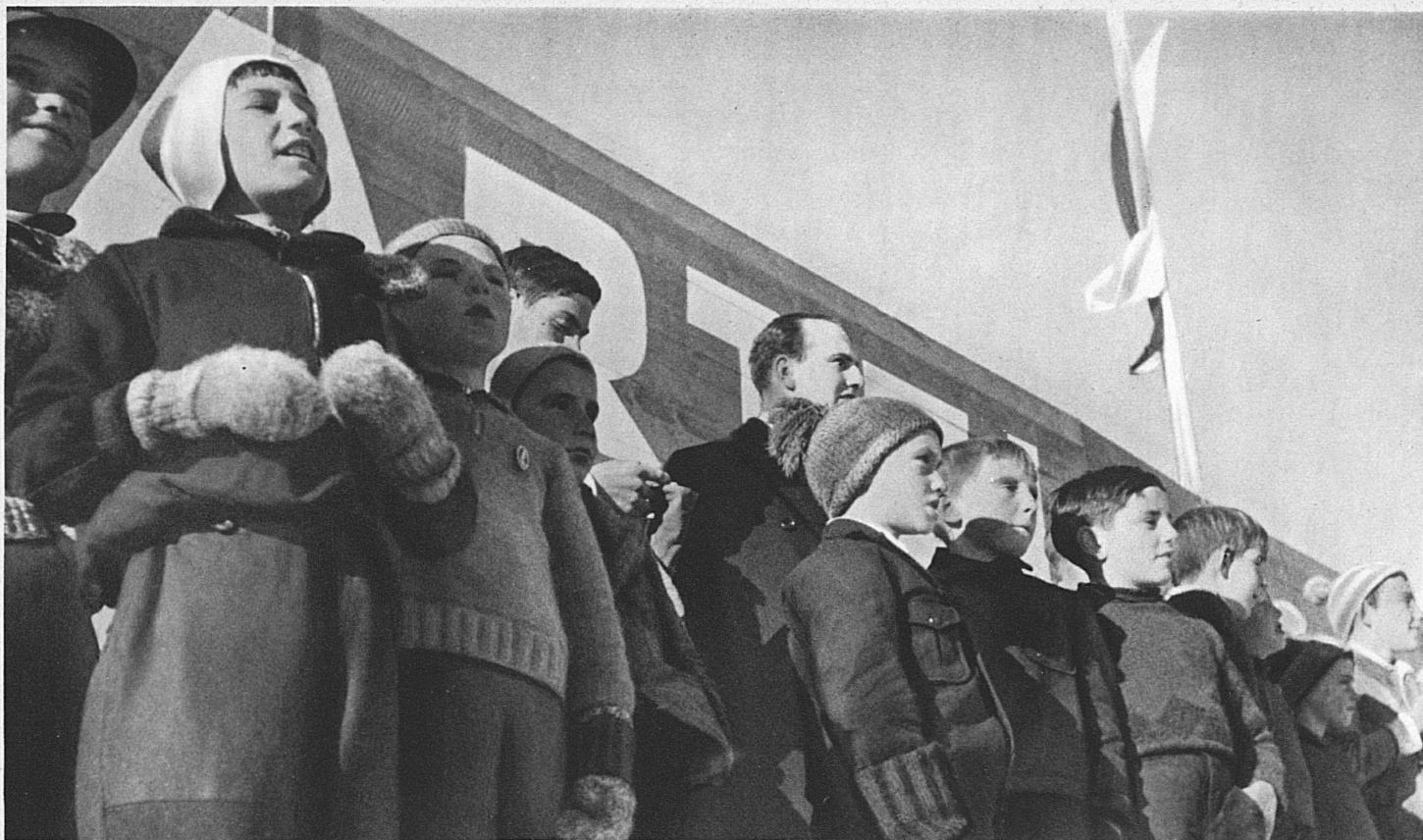
Wintersport, die grosse Leidenschaft der Jugend. Zuschauer bei den Eishockey-Weltmeisterschaften in Davos, Februar 1935 - Le sport d'hiver, passion des gosses. Le bon public des championnats du monde de hockey, Davos 1935 - Winter and Sport combined form youth's ideal. Spectators at the Ice Hockey World's Championships in Davos, February 1935