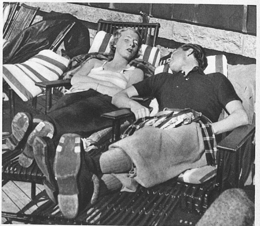
Siesta in der warmen Wintersonne - La bonne sieste au soleil d'hiver - Siesta in the warm winter sunshine