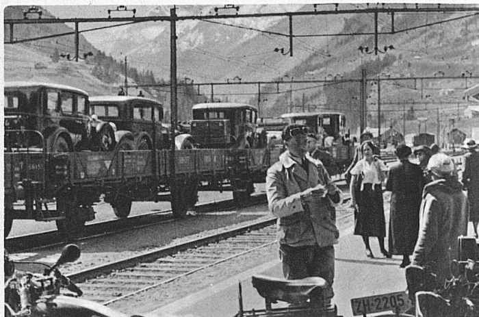
Autotransport durch den Gotthard - Transport des autos par le Gotthard

Solche unnötige Verzögerungen aber sind im Winter besonders unerwünscht, da der Fahrplan ohnehin Rücksichten besonderer Art zu nehmen hat. Es ist z. B. nicht damit getan, dass die Bundesbahnen einen ansehnlichen Park von Schneepflügen besitzen — es sind ihrer 35, darunter eine Schneeschleudermaschine, die allesamt während des Herbstes in den Werkstätten revidiert worden sind —, den nützlichen Geräten muss auch die Möglichkeit des Einsatzes zwischen der normalen Zugfolge geboten werden. So hat der Fahrplangeneralstab schon frühzeitig ausgetüftelt, zwischen welchen Zügen