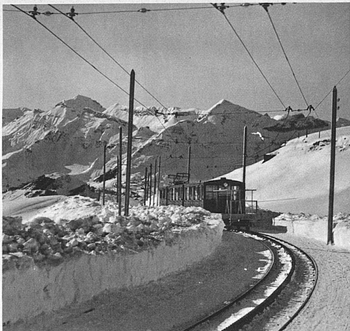
Die Jungfraubahn zwischen Scheidegg und Eigergletscher La ligne de la Jungfrau entre la Scheidegg et Eigergletscher

die Schneepflüge bei Bedarf jeweils eingeschmuggelt werden können, so dass bei plötzlichem Schneetreiben der verantwortliche Bahnmeister nur auf ein rosafarbenes Zirkular zu schauen braucht, auf dem mit minutiöser Genauigkeit angegeben ist, wie oft und wann die Maschine freie Strecke vorfindet. Auch die Wintersportler, denen ja in erster Linie das Geschenk der verbilligten Sonntagsbillette zugute kommt, hat man bei der Aufstellung des Fahrplans nicht vergessen. Noch längst bevor die Skis und Schlitten vom Estrich geholt worden sind, haben die Bahnhofsvorstände Anweisungen erhalten, was sie bei günstigen Schneeverhältnissen zu tun haben. Man hat nicht nur daran gedacht, dass die Züge verstärkt werden müssen, es ist auch präzise bei jedem einzelnen Verstärkungswagen angegeben, wo er eingereiht werden solle und ob er nur für Skifahrer zu reservieren sei. Es ist ferner ein regelrechter Kundschafterdienst für den Winterverkehr organisiert worden, der dem Zugs- oder Stationspersonal aufgibt, seine Wahrnehmungen über die mutmasslichen Frequenzen telephonisch dorthin weiter zu melden, wo bei starkem Andrang Abhilfe geschaffen werden kann.