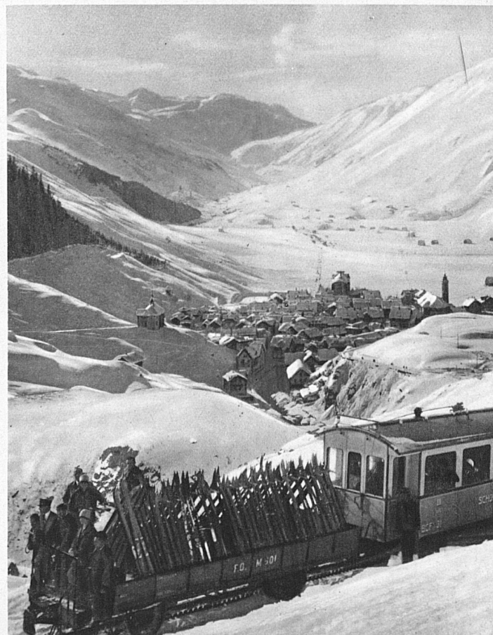
Ein Blick ins Skigebiet von Andermatt am Gotthard - Dans les champs de ski d'Andermatt