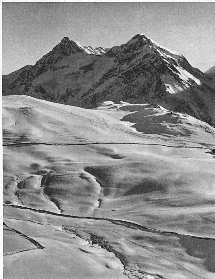
Die Tschuggenalp bei Arosa - La Tschuggenalp près Arosa