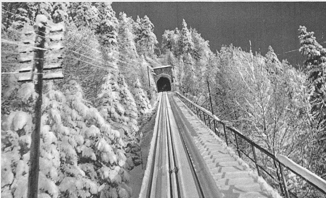
Von St. Immer durch den verschneiten Jurawald zum Mont Soleil - De St-Imier au Mont-Soleil par la forêt de blanches dentelles