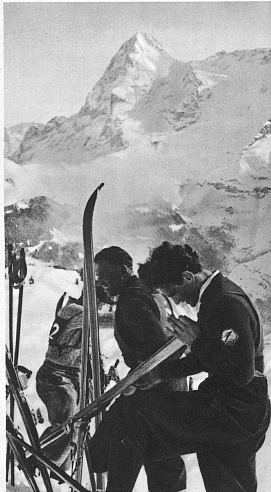
Vor dem Start in Mürren – Dernier fartage (Mürren)