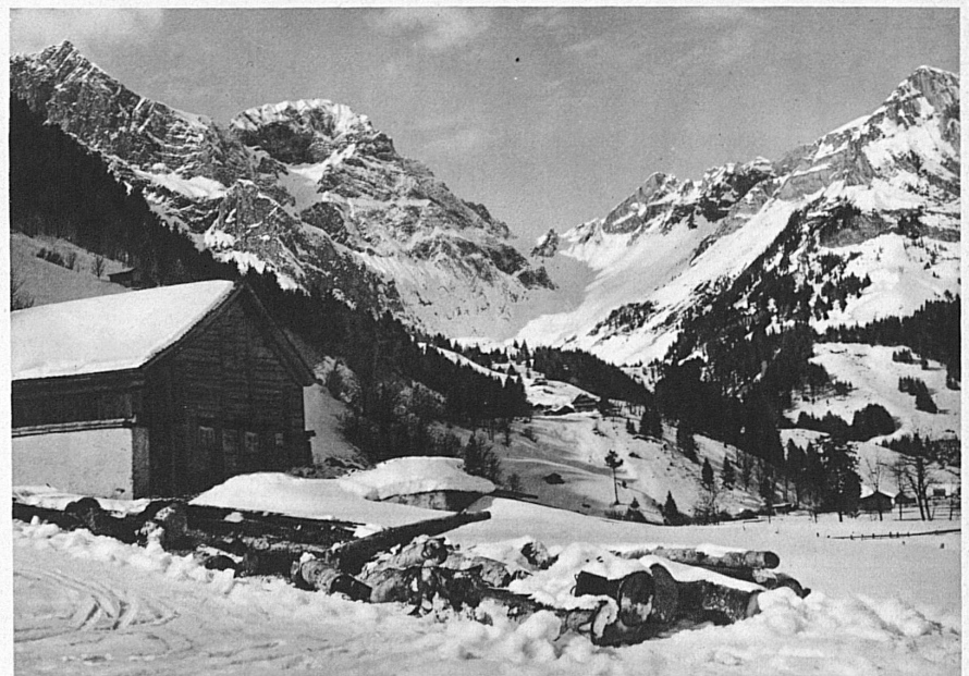
Hanghorn und Juchlipass bei Engelberg – Près d'Engelberg

auf dem sie ihr Geltungsbedürfnis erproben und sich auf das Leben vorbereiten kann in einer Weise, wie es viele unserer Nachbarn nicht können. Diese unendlichen Möglichkeiten zur seelischen und körperlichen Vorbereitung unserer nächsten Generation für den Lebenskampf voll auszunützen, ist meines Erachtens eine unabweisbare Pflicht aller derer, die sich mit diesen für die Zukunft unseres Volkes wichtigsten Fragen zu befassen haben.