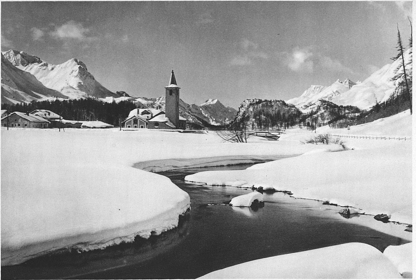
Sils-Baseglia im Oberengadin – Sils-Baseglia en Haute-Engadine